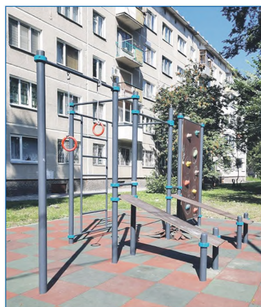
Спортивная площадка с современным покрытием на ул. Зорге, 219

— Проект предусматривает подготовку спортсменов высокого уровня. По сути, это программа подготовки тренеров и в целом инфраструктуры для того, чтобы целенаправленно, внимательно следить за ростом спортивного мастерства ребят из дворовых команд и самых одаренных и пре-