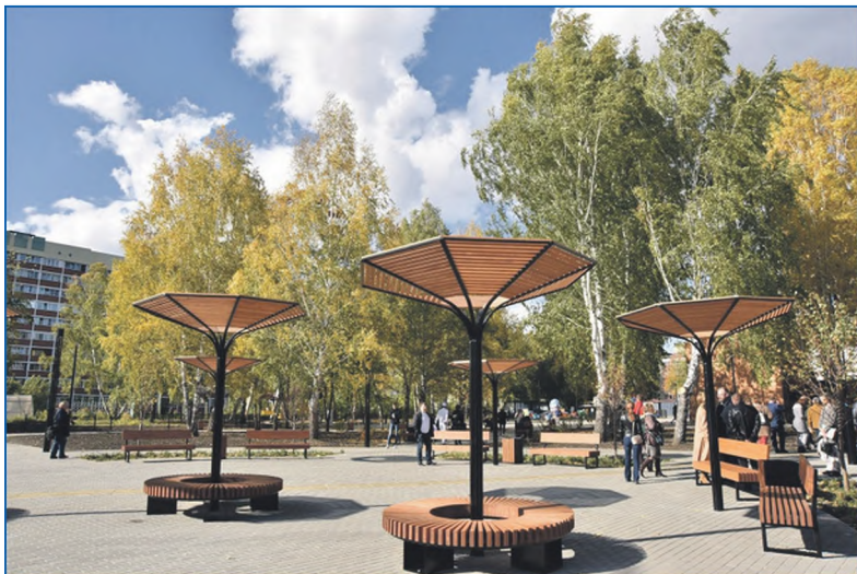
Дисперсный парк на Затулинке

В 2021 году из городского бюджета было выделено 20 млн руб. на благоустройство прилегающей территории. В частности, возле кинотеатра «Рассвет» и перед магазином «Сибирь» были установлены дополнительные опоры освещения, сделано озеленение, ремонт и асфальтирование дорожек и тротуаров. В нынешнем году работы продолжатся. Печалит одно — что в таком замечательном месте из-за пандемии нет возможности проводить массовые мероприятия и фестивали, хотя идей в этом направлении у нас очень много. Ждем снятия ограничений, тогда парк заработает в полную силу.