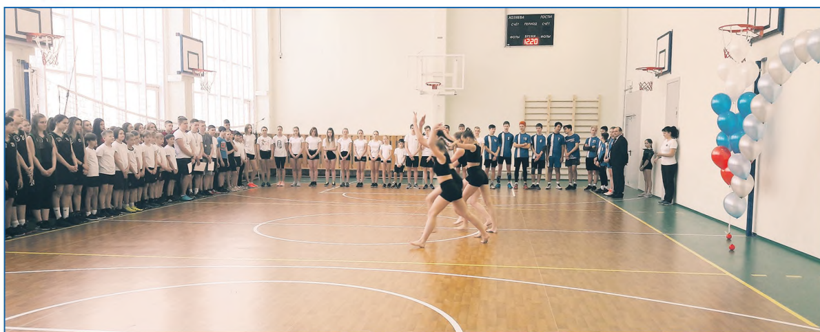
Новый спортзал в гимназии №7