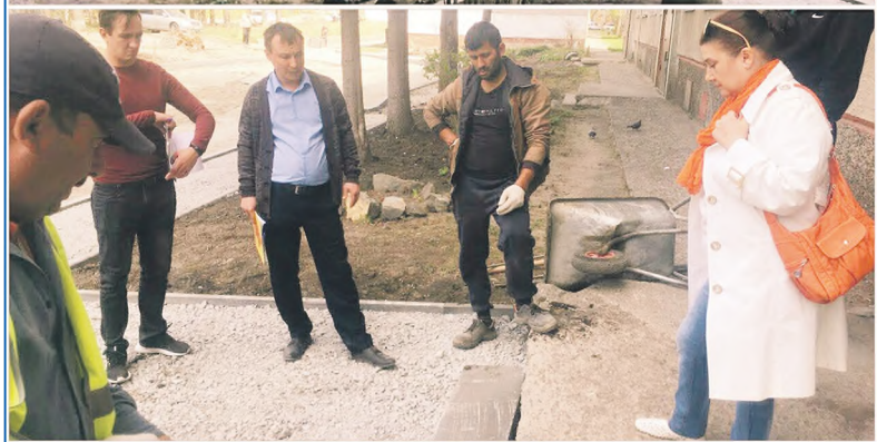
Работы по благоустройству контролируют помощники депутата и жители