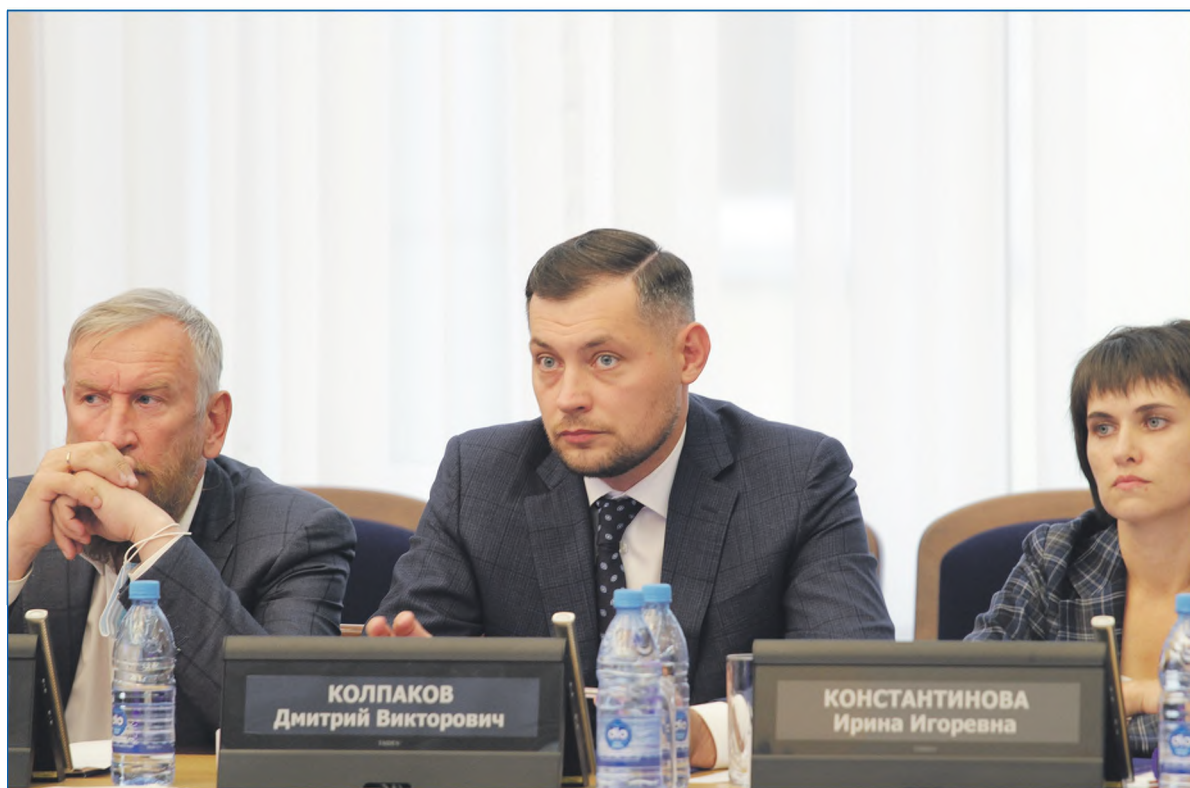
Опыт работы в Совете депутатов помогает решать проблемы территории округа

Понятно, что сегодня есть вопросы и к подвижному составу, и к состоянию рельсов, но об их за-