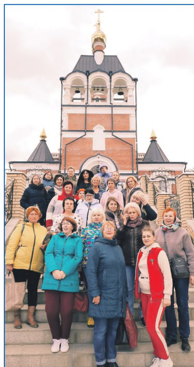
Поездка на святой источник работников детских садов округа

В ходе экскурсии кировчане узнали об истории создания этих жилых массивов, о выдающихся людях, которые стояли у истоков нашей науки. Увидели основные достопримечательности города и воочию посмотрели уникальные научные центры Сибири.