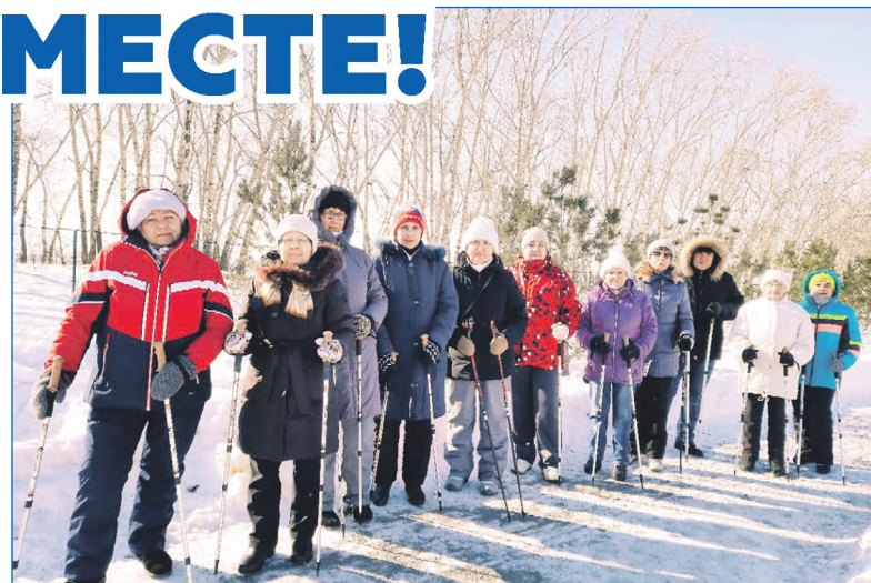
Скандинавская ходьба полезна для всех

В этом году депутаты вместе с фондом «Общее дело» и Олимпийским советом также разработали новый проект, он называется «Выходные со спортом» и проводится на разных площадках Кировского района по субботам. В нем принимают участие знаменитые спортсмены из клуба