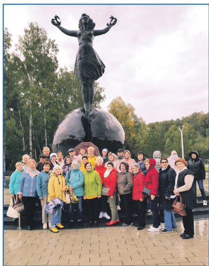
Активисты Затулинки — главные помощники в работе депутата — на экскурсии в Кольцово

«Святой ключ» — так официально называется родник в поселке, вода из которого известна своими целебными свойствами. Отдохнуть в тихом, умиротворяющем месте, погреться на солнышке, попить воды из источника и, конечно же, пообщаться — такая программа стала настоящим подарком для нескольких десятков жителей округа, посетивших знаковое место родного края.