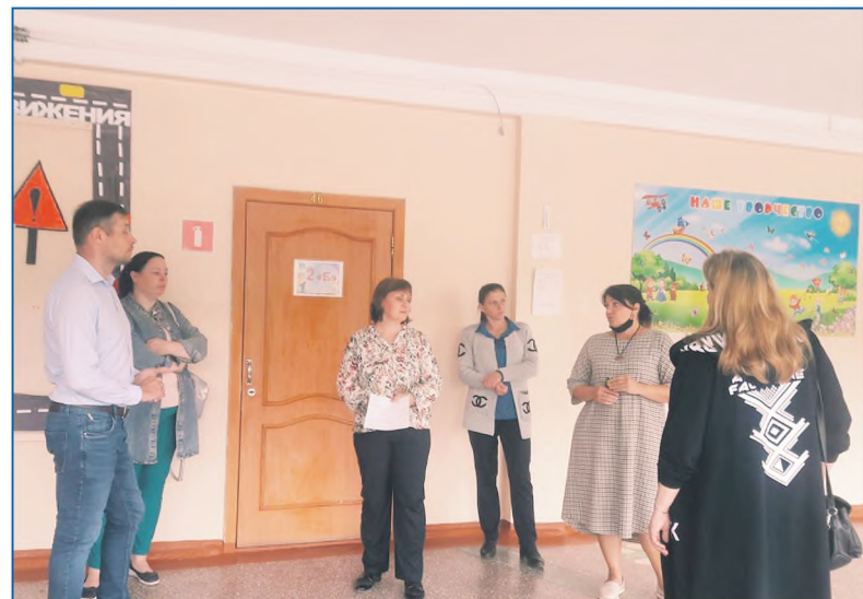
Встреча с родительским комитетом школы №108 по ремонту мастерских

Я сам живу на Затулинке. И, скажу откровенно, когда велись работы, то, как бы поздно вечером я ни возвращался домой после