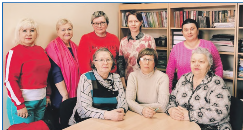
«Школа мудрого блогера» — еще один проект фонда «Общее дело» по обучению работе на компьютере и в соцсетях

А помогли им в этом опытные новосибирские блогеры,