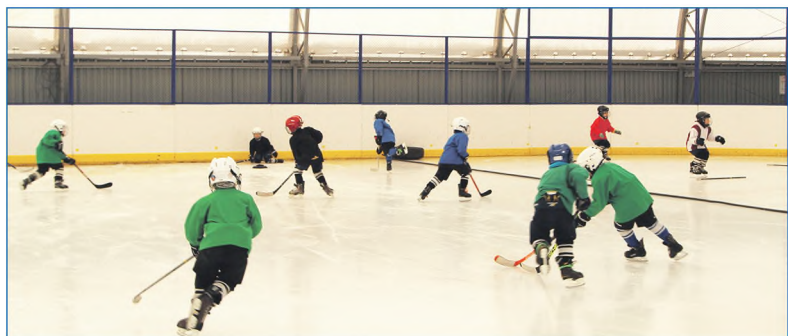
Крытая спортивная арена на ул. Зорге, 107, работает круглый год

И это хорошо! Даже если они высказывают недовольство, критикуют. Потому что в такие моменты я понимаю, что надо еще серьезнее, еще тщательнее разобраться в проблеме. Диалог с жителями — это та база, на которой основывается вся деятельность депутата. По всем вопросам мы советуемся с жителями, проводим собрания во дворах, в трудовых коллективах, в детских садах и школах, принимаем совместные решения.