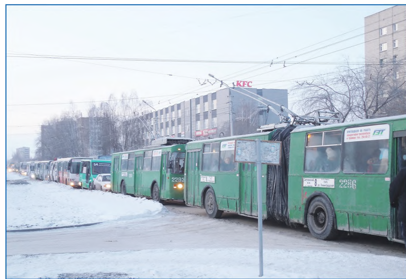
Выехать с Затулинки утром проблематично

Начнем с внутриквартальных проездов. Каждый год мы асфальтируем дороги в нескольких