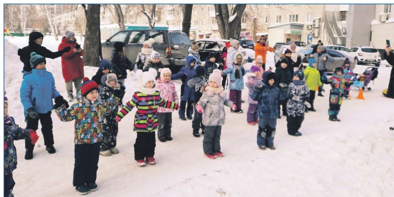
Выходные со спортом — зарядка для всей семьи!