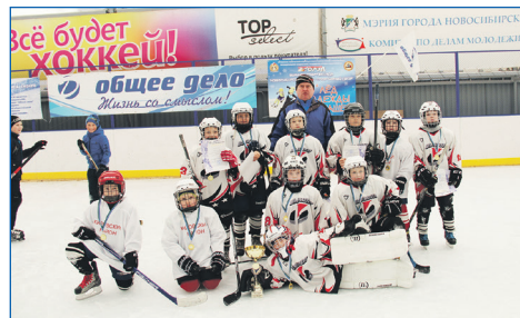
В крытых спортивных модулях проходят регулярные тренировки с профессиональными инструкторами

И, конечно же, я хочу довести до завершения те большие проекты, которые мы начали, наказы, которые не удалось реализовать в этом созыве. Я считаю, раз уж взялся — нужно делать! ■