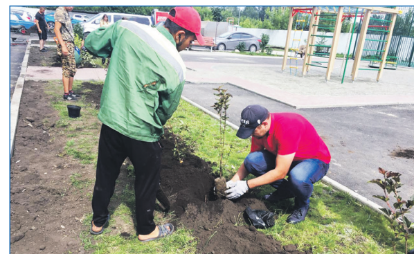
Жители вместе с депутатом озеленяют дворы после ремонтов

На участке от детского отделения ГБУЗ НСО Городская поликлиника №22 до Ледового дворца спорта «Ледовая арена»