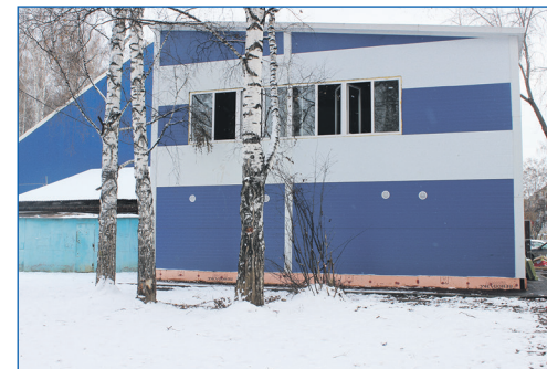
Теплый модуль на ул. Зорге, 107