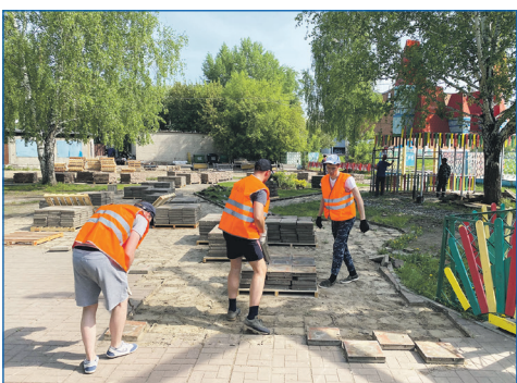
Строительство дисперсного парка началось