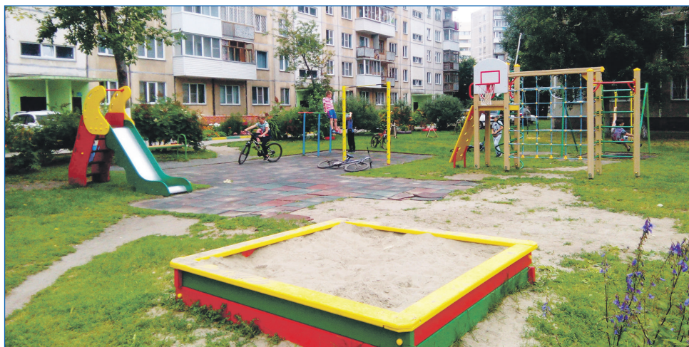
Детские площадки построены по приказам практически в каждом дворе