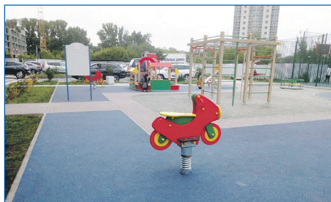
Ул. Зорге, 275 после ремонта

Кроме того, в Кировском районе очень много активных жителей, которые горячо поддерживают различные инициативы по улучшению качества жизни. Огромное им за это спасибо! Важно то, что горожане сами готовы выходить во дворы, что-то делать своими руками. Зачастую даже по дороге в приемную я встречаю людей, которые не просто здороваются, но и обращают мое внимание на волнующие их вопросы: вот тут яма, там гаражи несанкционированные, здесь машины на газон ставят. И благодаря таким активным жителям очень многое получается сдвинуть с места и изменить в лучшую сторону.