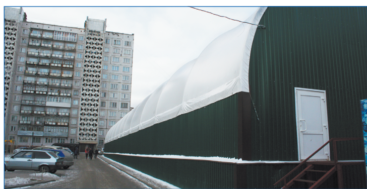
Многофункциональный спортивный комплекс на Вертковской

– Благодаря вашей работе в городе реализовали много действительно необходимых жителям инициатив. Кому вы хотите выразить благодарность за помощь?