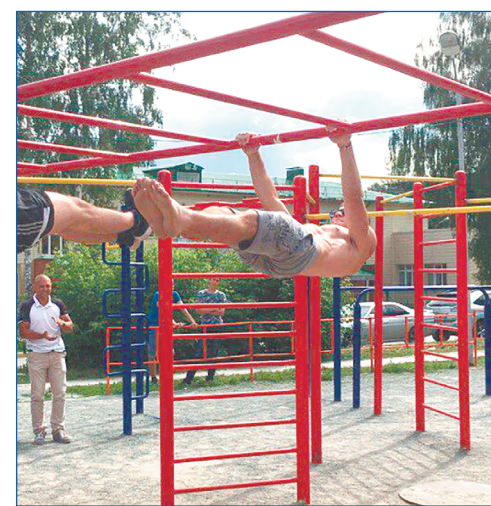
Площадка для воркаута