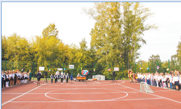
Спортивная площадка возле школы № 47