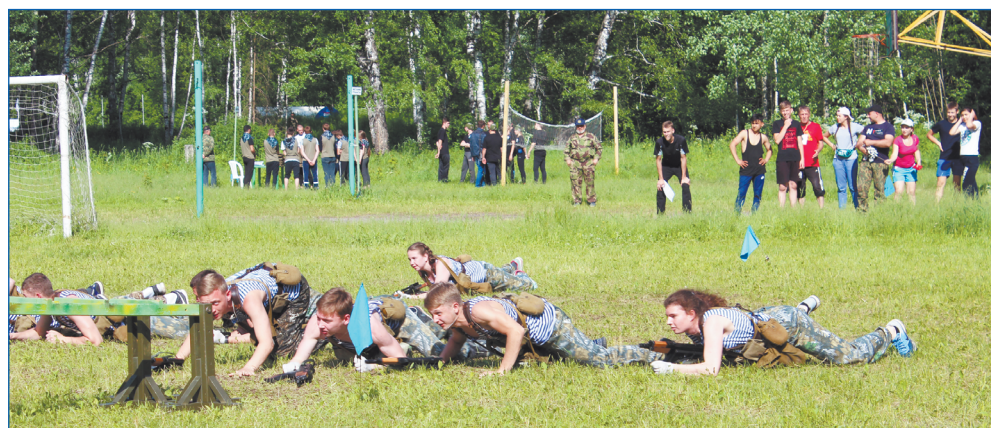
Военно-патриотическая игра «Зарница»