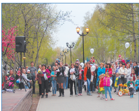
Праздник на аллее Молодежная

К примеру, сейчас много запросов на создание специального безопасного резинового покрытия на детских площадках, асфальтирование тропинок, установку ограждений, новых спортивных площадок, уличных тренажёров, добавление освещения во дворах. И это нормальное желание людей – улучшить условия жизни.