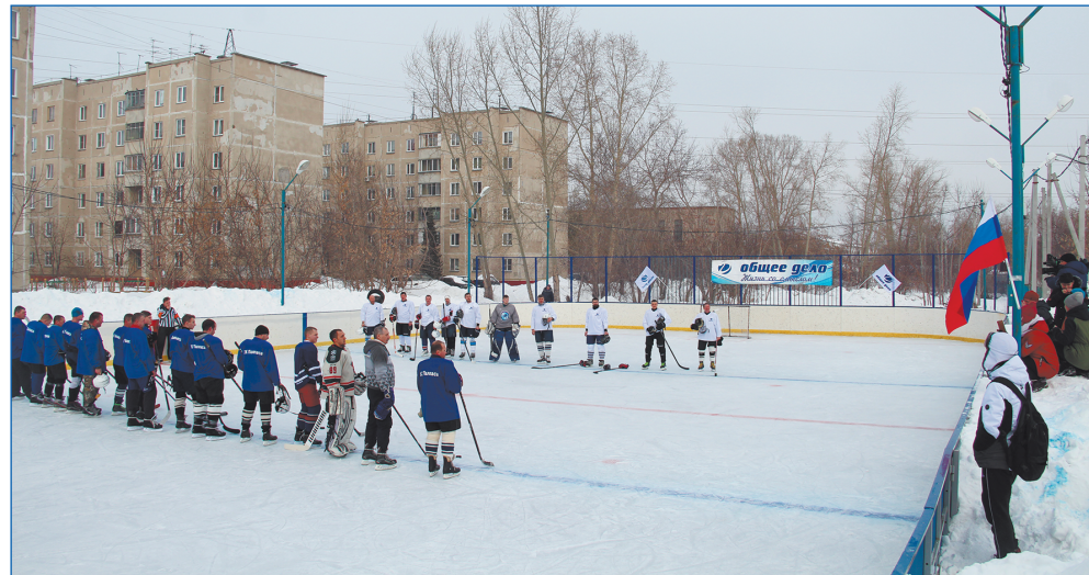
Открытие теплого павильона на Палласа

федерации и фонда «Общее дело». До конца этого года детские сады получают 500 пар коньков. И эта работа будет продолжена. Ребята, у которых хорошо получается кататься, могут продолжить развиваться в этом направлении в секции фигурного катания. Для остальных такие занятия – полезный досуг, позитивно от-