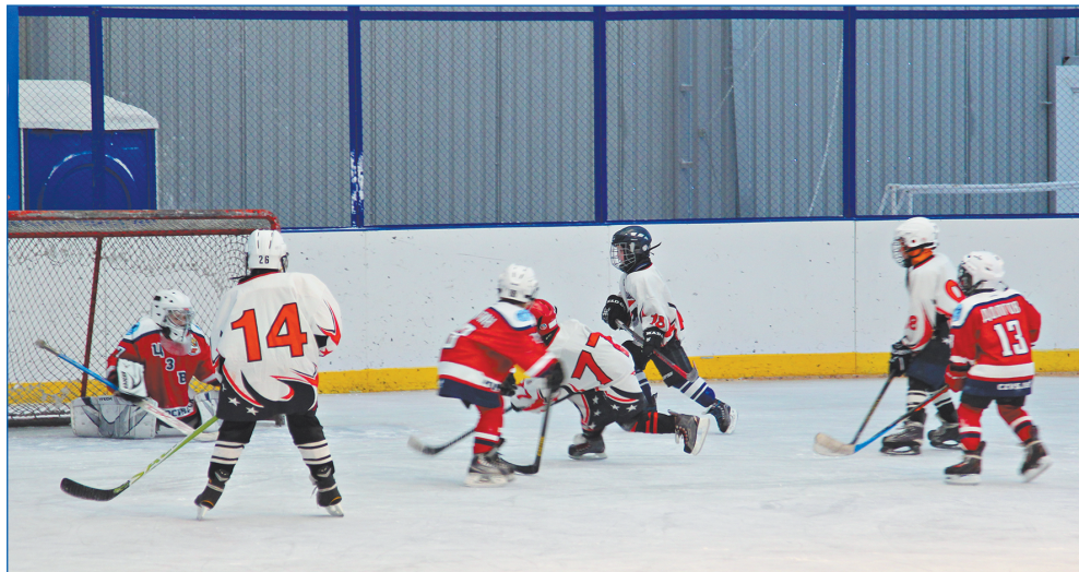
Регулярные тренировки проходят в спорткомплексе на Вертковской

– Планов много. Остаются невыполненные наказы, над которыми ещё предстоит работать. Они ёмкие как в части финансов, так и по времени: в основном это капитальные ремонты школ и детских садов. Я не оставлю без внимания столь важные, требующие комплексного решения вопросы. Также во время предвыборной кампании мы с помощниками будем плотно взаимодействовать с жителями, чтобы выявить проблемные моменты и включить их в план работы на следующие пять лет. Я надеюсь, что люди будут по-прежнему активно обращаться ко мне за помощью! ■