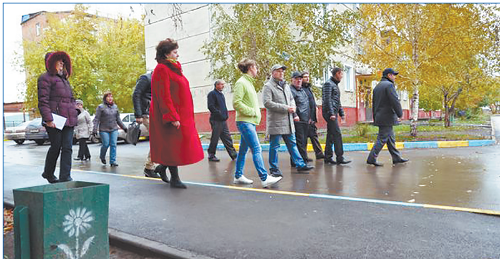
Качество работ по благоустройству контролируют депутаты вместе с жителями