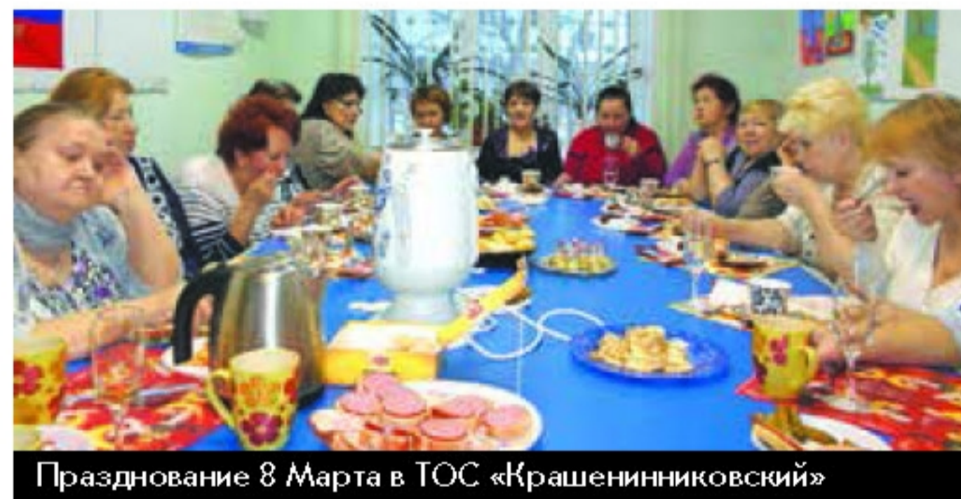
Празднование 8 Марта в ТОС «Крашенинниковский»