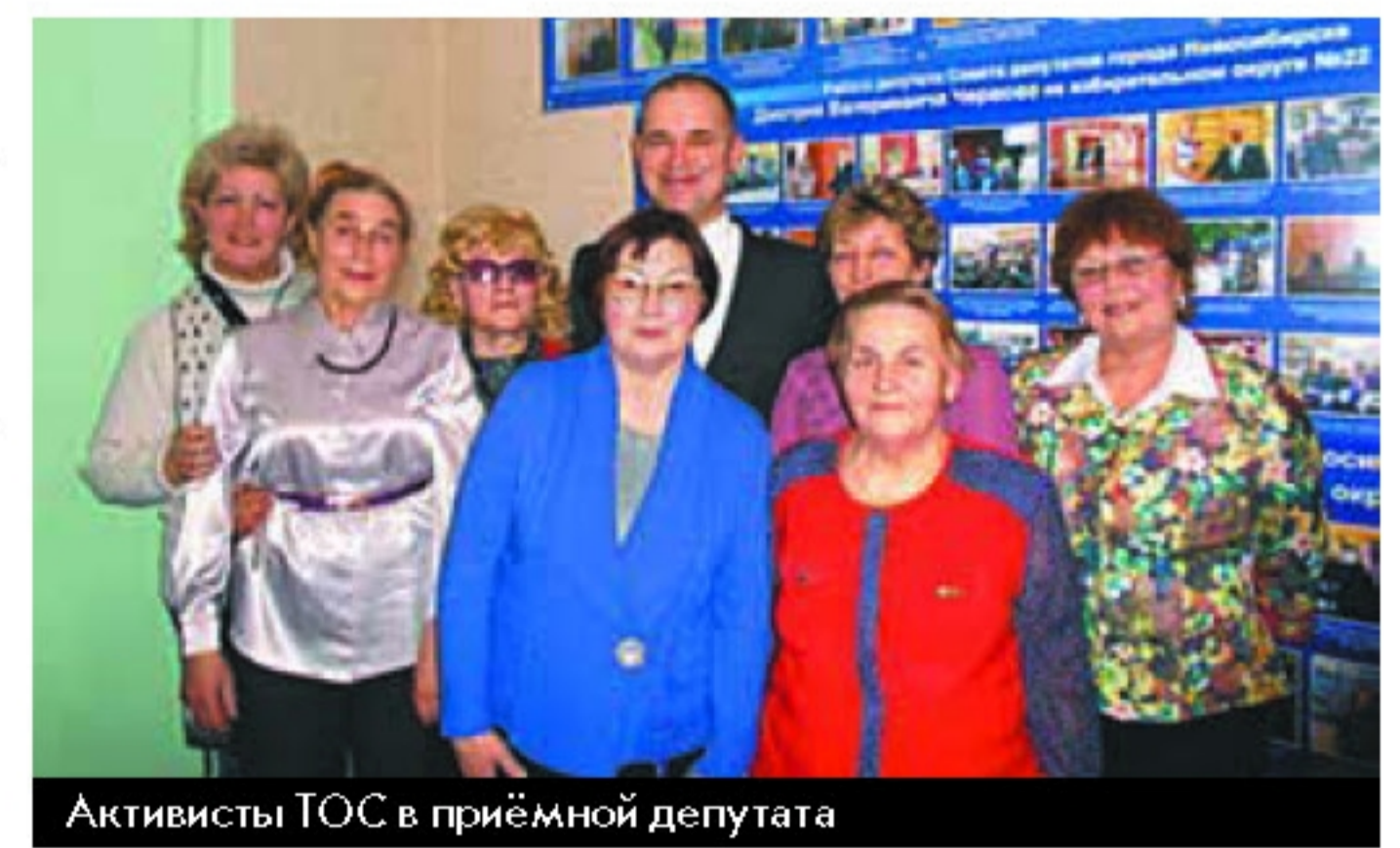
Активисты ТОС в приёмной депутата

Финансовая помощь территориальным органам самоуправления (ТОС) также не попала в список реализуемых наказов, но оказывается на дополнительные средства, выделяемые муниципальным бюджетом депутатам на обращения граждан. В рамках этого финансирования для ТОС «Ватутинский» приобретены колонки для ноутбука и электрическая швейная машина, мебель и фотоаппарат для ТОС «Телецентр», музыкальный центр для ТОС «Краснинниковский», мебель для ТОС «Выставочный».