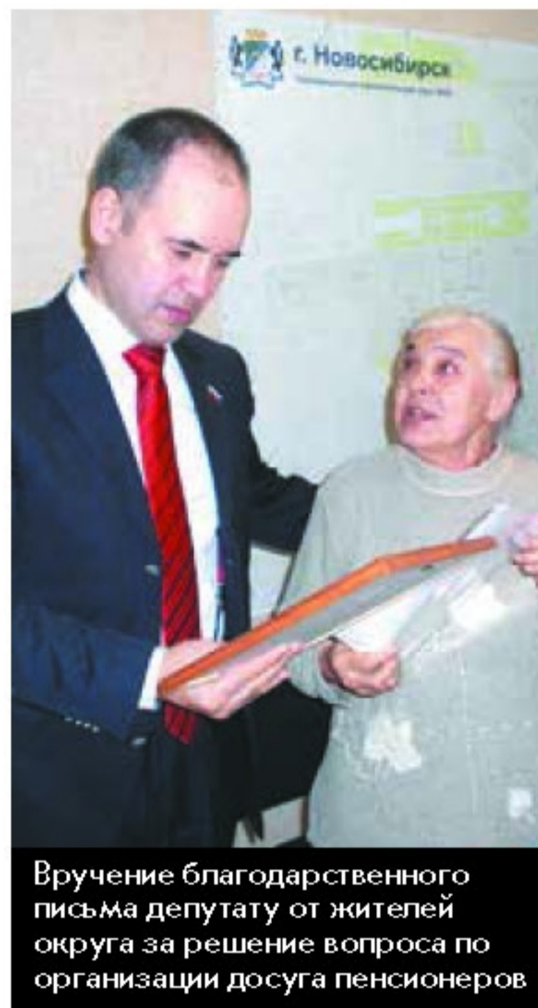
Вручение благодарственного письма депутату от жителей округа за решение вопроса по организации досуга пенсионеров