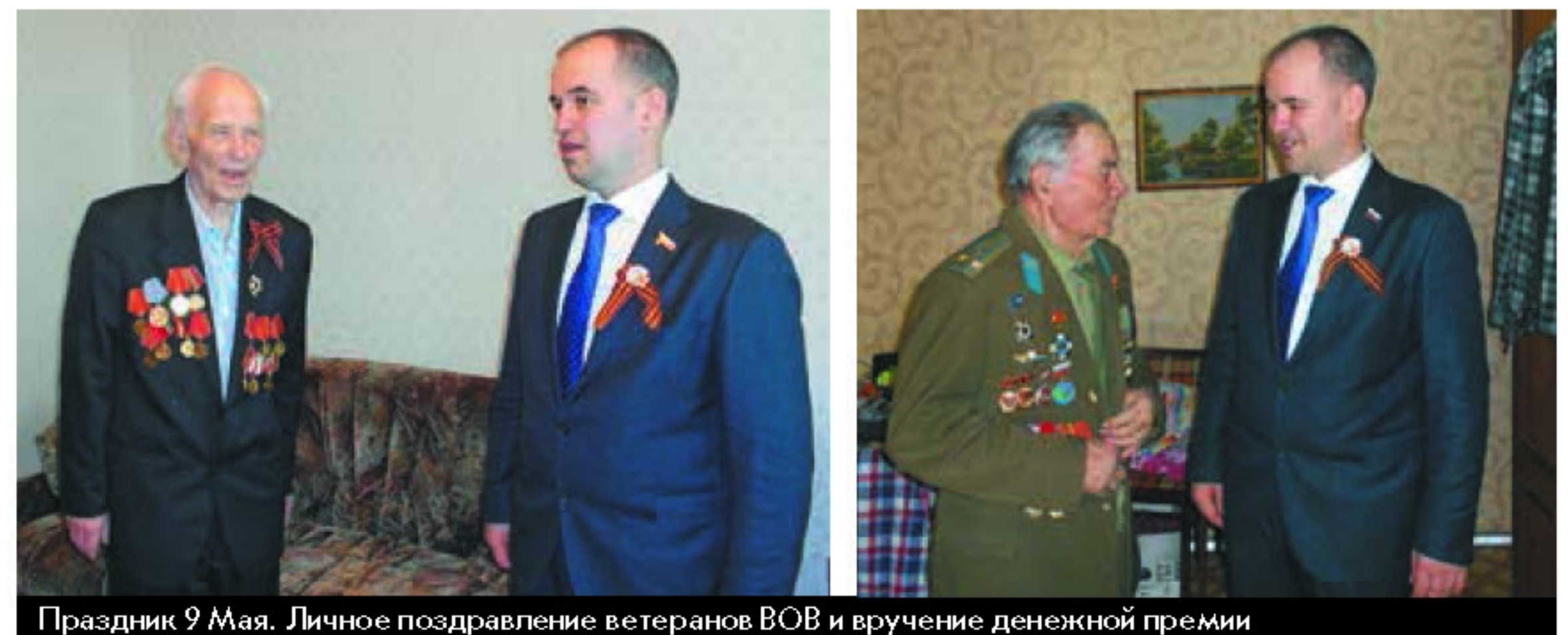
Праздник 9 Мая. Личное поздравление ветеранов ВОВ и вручение денежной премии

танцевальных коллективов. Ветераны, труженики тыла услышали в свой адрес слова благодарности и признательности от молодого поколения и получили цветы. По традиции каждый участник мероприятия отведал солдатскую кашу, а кому позволило здоровье – и фронтовые сто граммов.