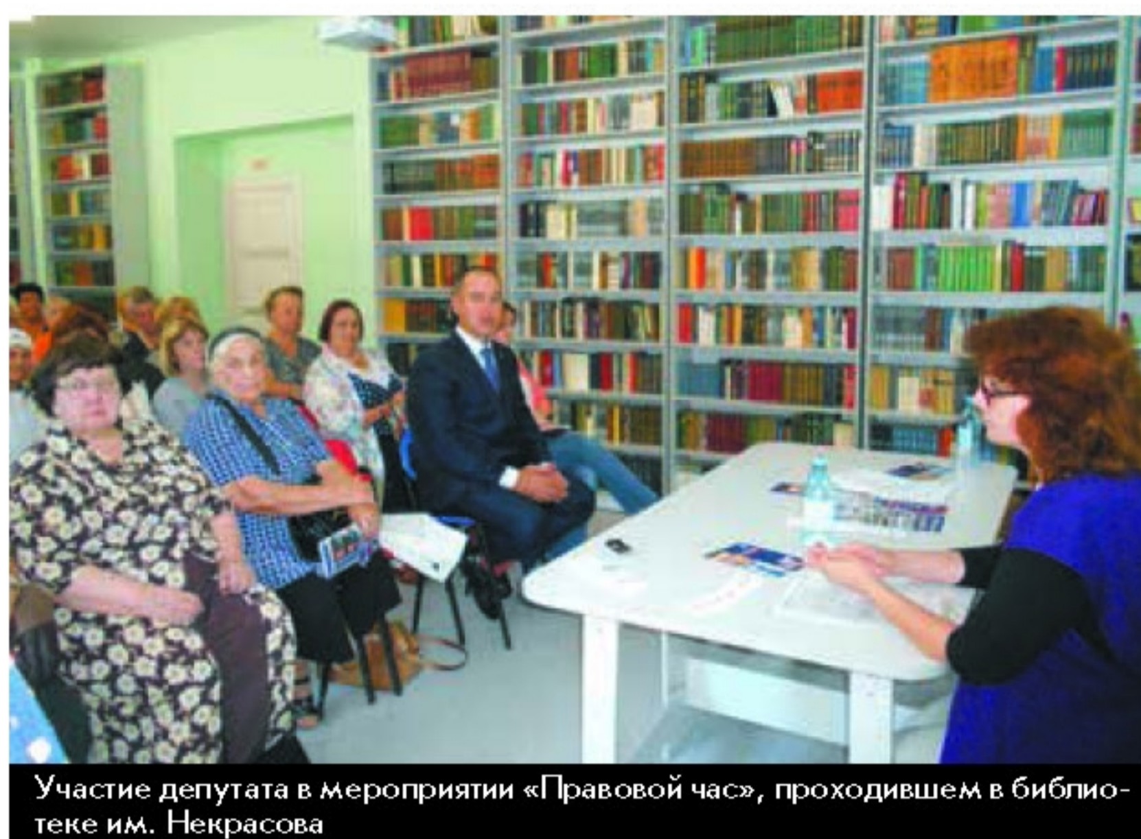
Участие депутата в мероприятии «Правовой час», проходившем в библиотеке им. Некрасова