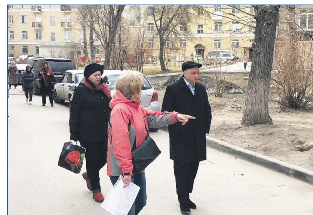
Жители рассказывают депутату о проблемах двора

которого нам удалось провести ремонтные работы. Сейчас там все в цивилизованном виде, абсолютно сухо, и мы тоже этим довольны.