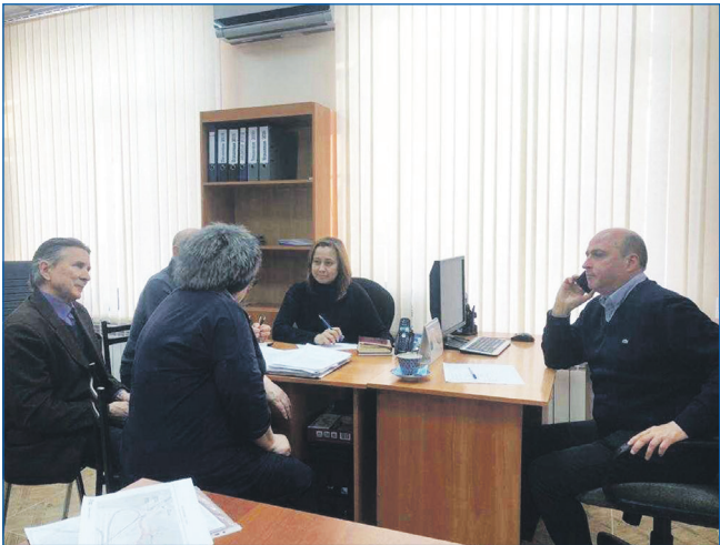
На приеме у депутата

— В этом созыве, который начался в 2015 году и заканчивается в сентябре 2020-го, были поставлены следующие основные задачи: первое (и главное) — увеличение количества зеленых зон, скверов, парков шаговой доступности в округе; второе — это помощь в реконструкции и ремонте образовательных учреждений.