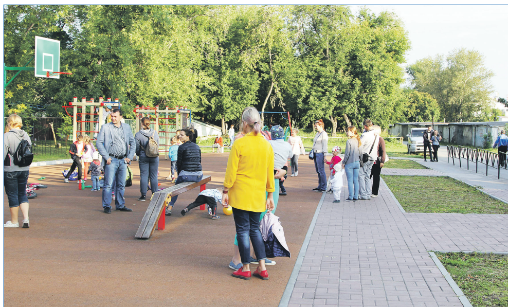
Сквер «Новогодний» в короткий срок стал одним из любимых мест отдыха для жителей левобережья