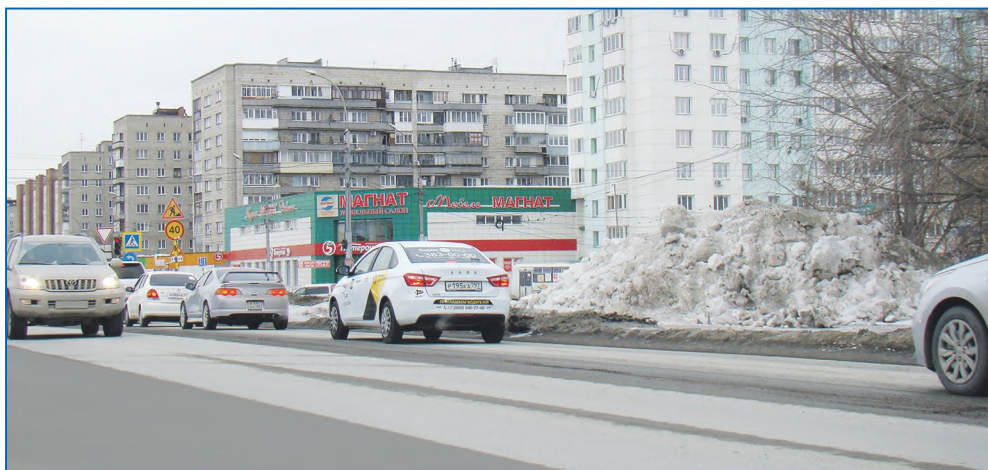
Ул. Широкая после капитального ремонта в границах ул. Троллейной и Связистов