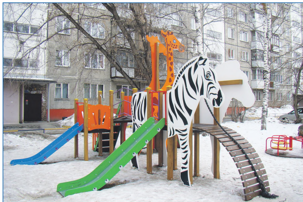
Новая детская площадка во дворе дома по ул. Котовского, 50