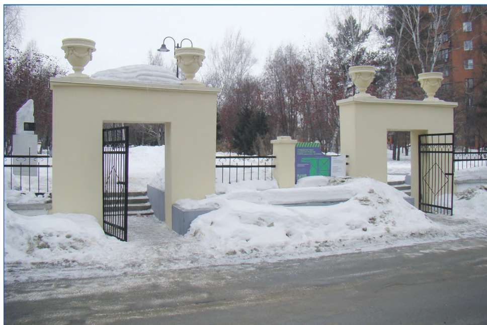
Новая входная группа и отремонтированный забор Сквера им. Гагарина