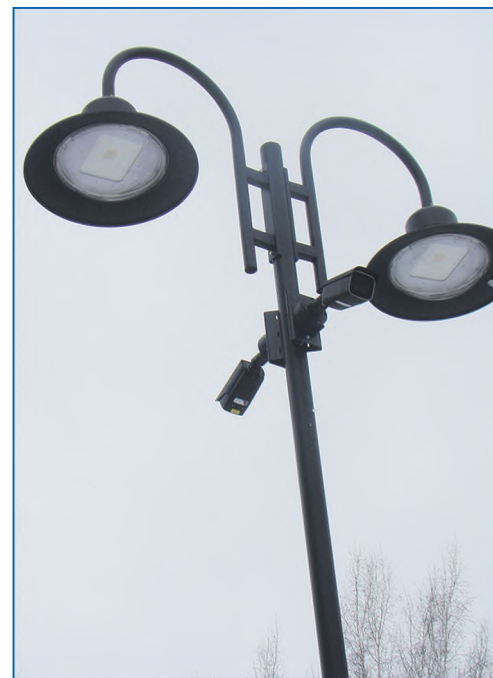
Установленная системы освещения и видеонаблюдения в реконструированном Сквере им. Гагарина