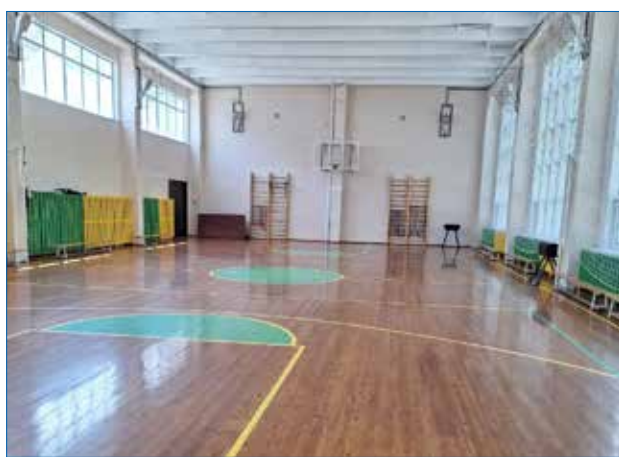
Проведен капитальный ремонт спортзала, раздевалок, пищеблока и столовой в школе 41

— Конечно же, основная масса наказов — это благоустройство территории, асфальтирование, парковочные места. Очень