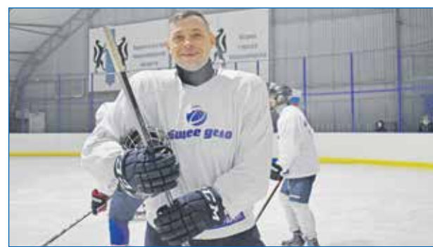
Развитие дворового, доступного спорта – приоритет в работе депутатов Кировского района

В остальном темы обращений — это спил аварийных деревьев, благоустройство территории, детская площадка, которая не попала в наказания, и тому подобное. Конечно, это все уже дальше будет исполняться по принципу — есть ли деньги, смогли ли мы где-то сэкономить. В этом нам помогает, кстати, ФЗ №44 о госзакупках. Если, например, проводится конкурс на асфальтирование территории на округе, и в ходе конкуренции цена контракта снижается,