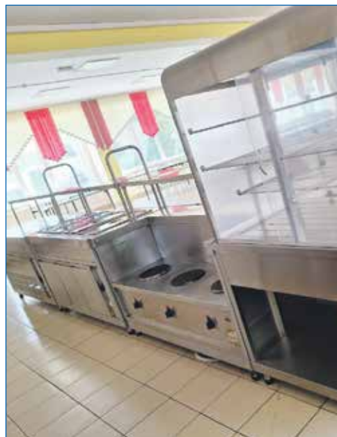
Столовая в 41 школе