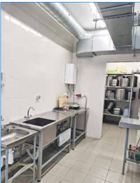
Кухня в 41 школе с современным оборудованием