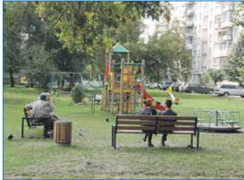
Новая детская площадка на ул. Зорге, 209