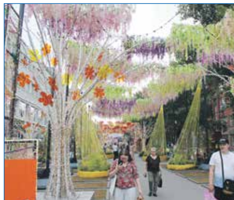
День города стал долгожданным праздником для новосибирцев

— В нынешнем году было принято решение об отмене прямых выборов мэра Новосибирска. И в будущем 2024 году впервые за несколько десятков лет главу муниципалитета