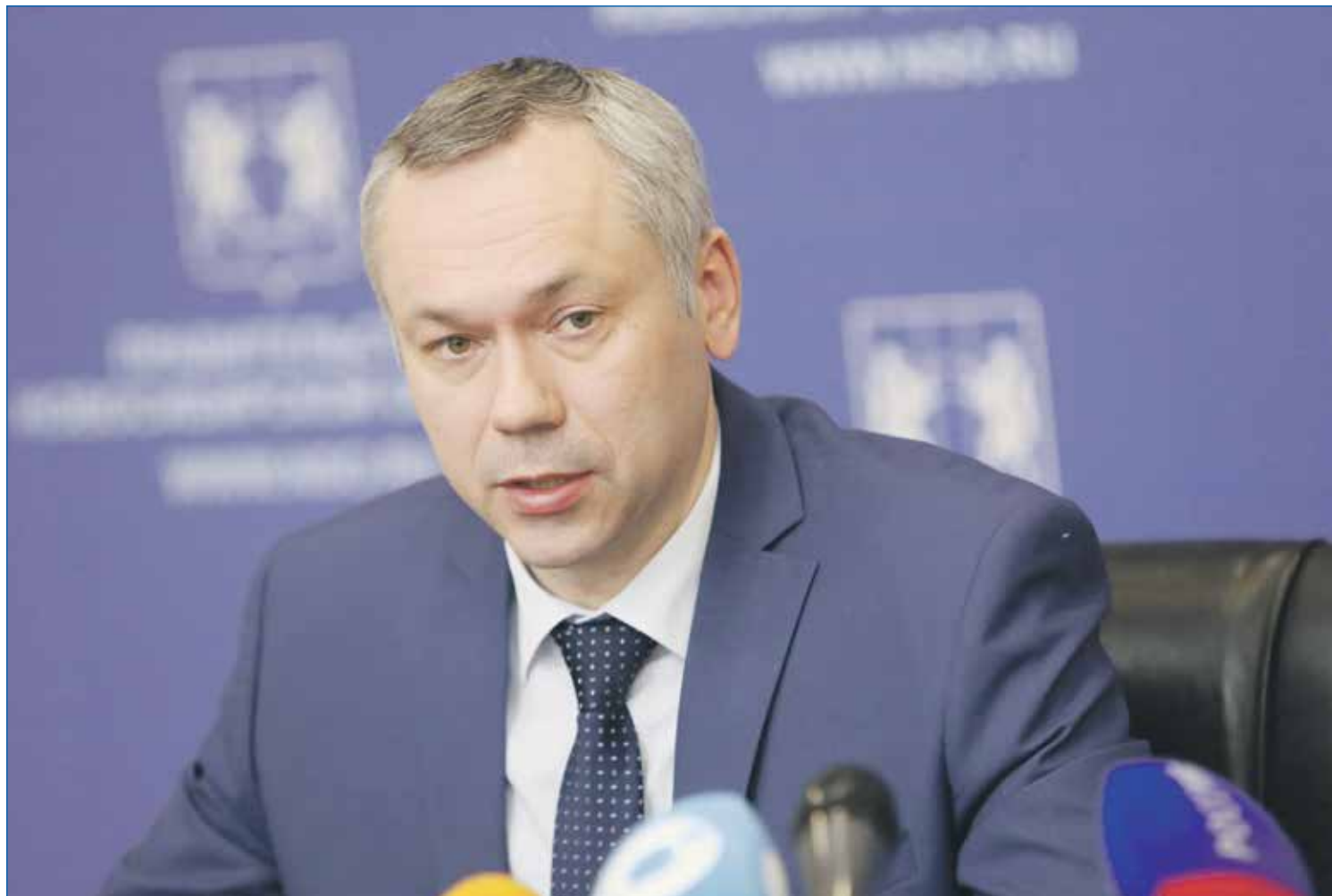
Андрей Травников, губернатор Новосибирской области

Здесь нельзя не отдать должное новосибирцам, которые отреагировали практически моментально. В срочном порядке пошла гуманитарная помощь — и от организаций массово, и от жителей округа, которые шли в общественную приемную с мешками с пакетами. И до сих пор идут, это прекрасно, что такая поддержка поступает от граждан.