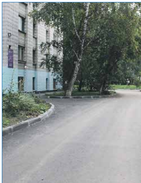
Благоустройство на ул. Зорге, 6, 8, 10