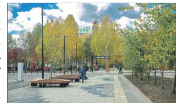
Проект строительства дисперсного парка отмечен на федеральном уровне

А как же не опираться на мнения и желания людей? Ведь они выбрали нас именно для того, чтобы мы работали для них и учитывали интересы и каждого, и большинства.