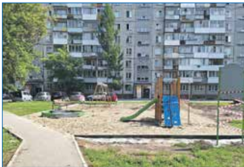
Продолжается строительство детских площадок на Зорге с прорезиненным покрытием