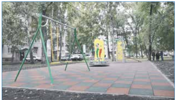
Площадка на ул. Зорге 207, построена по программе «Территория детства»

Кроме того, нужны средства на содержание территории, элементов и их ремонт. А на сегодня на обслуживание внутривозрастных площадок средств нет, и не дай Бог, если там что-то из-за поломки случится. Таким образом, опыт и время ждет от нас нового подхода, и сейчас мы обсуждаем новый