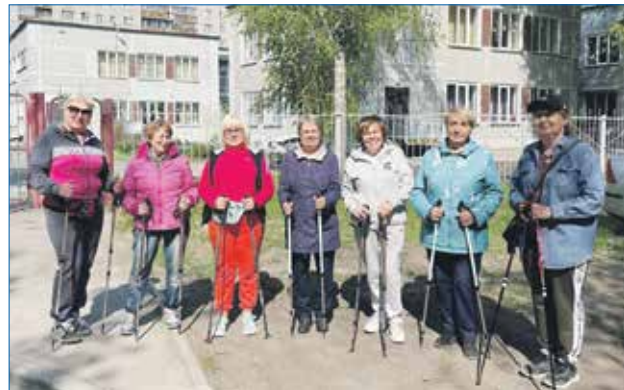
Скандинавская ходьба – проект фонда «Общее дело»