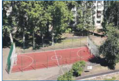
Зорге 74. Многофункциональная спортивная площадка