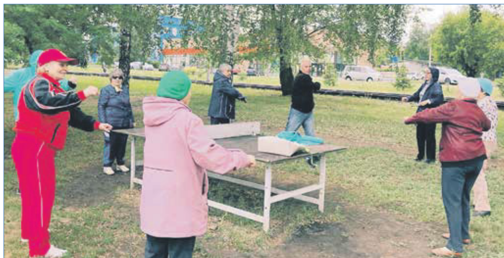
«Гимнастика на траве» — еще один спортивный проект

Хочу и всем остальным жителям нашего района и города поменьше сидеть дома, а больше двигаться, заниматься физкультурой — это главная основа отличного здоровья, бодрости духа и прекрасного настроения.