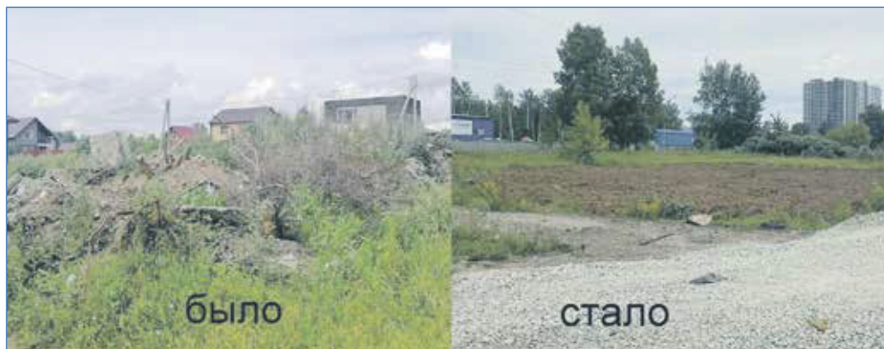
Одна из проблем частного сектора — дороги

Или проект «По законам дорог», который проводится в форме интеллектуально-развлекательной игры между командами старшеклассников (сборной командой волонтеров) и командой студентов 1 курса колледжа автосервиса и дорожного хозяйства.