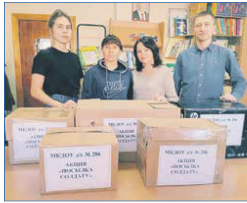
Сбор гуманитарной помощи в Донбасс

С момента начала мобилизации общественная приемная включилась в акцию «Посылка солдату» и еще больше людей стали участвовать в ней по зову сердца. У нас недоброжелатели часто реагируют на добрые дела, что это, дескать, привлекли «административный