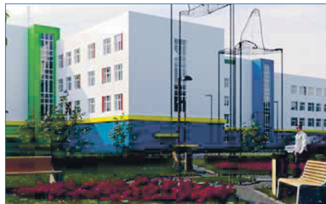
Проект строительства поликлиники в «Акатуйском» жилмассиве

Одна из поликлиник будет построена на улице Виктора Уса, она будет состоять из трех отделений: детского, взрослого и женской консультации. Срок сдачи намечен на второй квартал 2024 года.