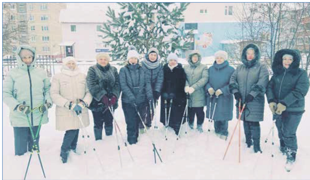
Группа любителей скандинавской ходьбы «Нордики»

Для содержания уличных коробок за счет депутатских субсидий были приобретены две снегоуборочные машины. Также куплено музыкальное оборудование для многофункционального спортивного комплекса по ул. Вертковской,