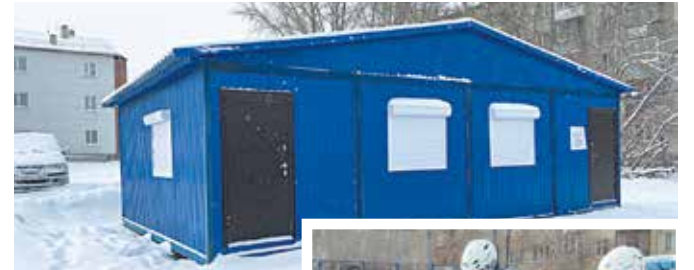
Открытие тёплого павильона на ул. Палласа

– Такое количество спортивных мероприятий не может не оказывать влияние на жизнь округа. Если создаёшь условия для людей, они активно принимают это и включаются в процесс. В ходе занятий спортом жители округа знакомятся друг с другом, сближаются и даже находят новых друзей. Такой зоной притяжения,