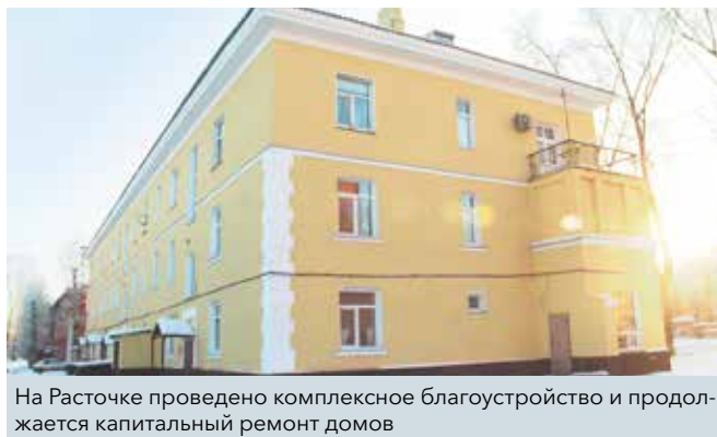
На Расточке проведено комплексное благоустройство и продолжается капитальный ремонт домов

Ещё одна потребность жителей Расточки – капитальный ремонт в жилых домах. Реконструкцию многих зданий на улице Мира должны были провести только через 10 лет, но мы оказали помощь инициативным жителям и помогли собрать необходимые документы, чтобы отремонтировать эти объекты досрочно. Несмотря на то что эта работа ведётся не один год, на округе остаётся немало домов, нуждающихся в срочном восстановлении. Помимо прочего, на Расточке требуется замена трамвайных путей. Это одна из тех задач, которая в силу финансовых затрат и других аспектов затягивается на года. Однако в ближайшее время, думаю, нам удастся двинуться с места. Работа продолжается!