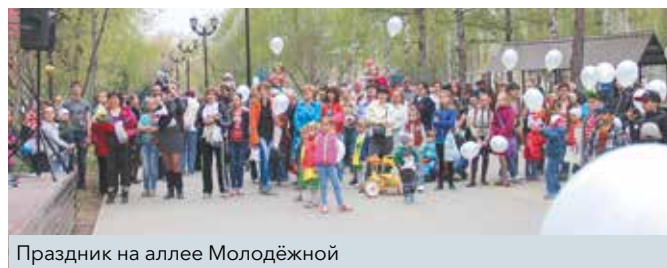
Праздник на аллея Молодёжной