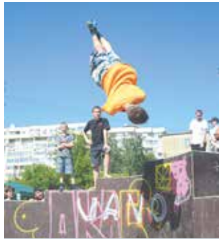
Самая большая площадка для паркура за Уралом построена по обращениям к депутатам

Новый толчок для развития дворовых видов спорта дало строительство тёплых модулей при хоккейных коробках, а также приобретение спортивной формы для хоккеистов. Доступность и близость спортивных объектов к дому будили ребят записываться в дворовые секции и активно заниматься хоккеем, футболом, флорболом, фигурным катанием.