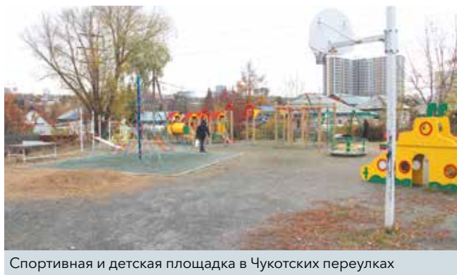
Спортивная и детская площадка в Чукотских переулках