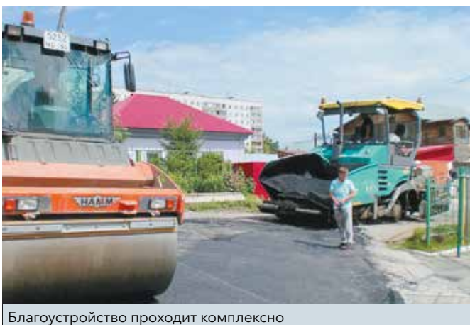
Благоустройство проходит комплексно