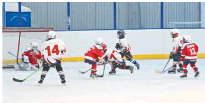
Регулярные тренировки проходят в спорткомплексе на ул. Вертковской

например, стала хоккейная коробка на ул. Палласа, 39, построенная по моему наказу. Рядом ней расположились спортивная площадка и 18 уличных тренажеров. Недавно там открыли тёплую раздевалку и сделали трибуны с навесом для болельщиков. Теперь спортивная и не только жизнь здесь кипит. Важно, чтобы подрастающее поколение с раннего возраста приобщалось к спорту и здоровому образу жизни, ведь именно из дворовых команд выходят будущие звёздочки российского спорта.