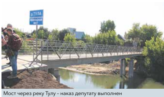
Мост через реку Тулу – наказ депутату выполнен

Также один из острых вопросов – отсыпка проездов в частном секторе. Предыдущие годы показали, что этот процесс требует времени, вплоть до изменения формулировки наказа. Мы столкнулись с тем, что при таянии снега весной или во время летних ливней насыпь смывает прямо в домовладения местных жителей. Это происходит из-за того, что перед отсыпкой не срезаются верхний слой почвы: уровень дорожного полотна постоянно повышается из-за отсева и щебня, а дома просаживаются. Мы приняли для себя решение следующие наказы выполнять иначе. На наш взгляд, первоначально необходимо подготовить верхний слой грунта, да-