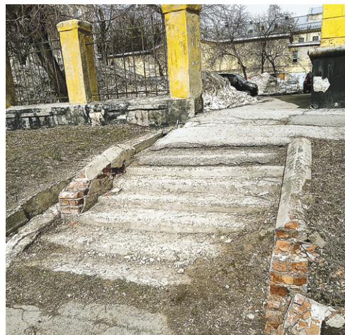
Один из примеров лестницы, требующей ремонта.

Во время сплошной инвентаризации конца 1990-х годов половина лестницы у ДК имени М. Горького отошла ТСЖ, а другая половина осталась в муниципальном