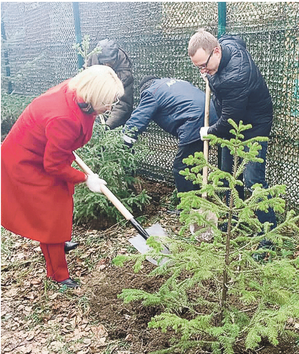
В благоустройстве и озеленении депутат всегда принимает непосредственное участие.

- Если мне доверят в будущем представлять Калининский район, направление моей деятельности в большей степени останется прежним. Буду так же решать проблемы ЖКХ. Сейчас назревает судебный процесс с региональным оператором по капитальному ремонту. Кроме того, надеюсь подключиться к подготовке к молодежному чемпионату мира по хоккею - он предполагает существенные изменения на улице Б. Хмельницкого, и нужно быть к этому готовым. Начну решать более глобальные и серьезные проблемы моего округа. Например, необходимо разобраться с открытой системой водоразбора и наладить адекватную поставку пригодной для питья воды в жилые дома. Я буду стараться создать для людей максимально комфортные и безопасные условия для проживания. ■