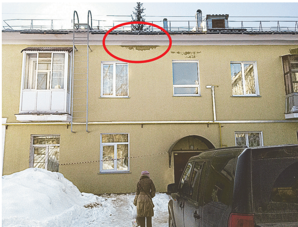
Под самой крышей видны подтеки.