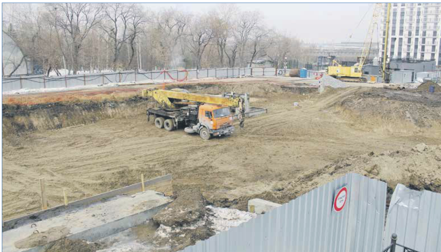
Ход «строительства» поликлиники №16 рядом с Парком Кирова (конец марта 2023)

Только в социальной сети «ВКонтакте» ( vk.com/alburmistrov ) расследование получило уже более 500 000 просмотров. В продолжение работы депутатом также направлены обращения полномочному представителю Президента в Сибири, в территориальные органы ФСБ, следственного комитета, МВД и областному прокурору. Теперь ставшие публичными махинации при строительстве должны получить оценку правоохранительных органов, а темпы строительства — ускориться.