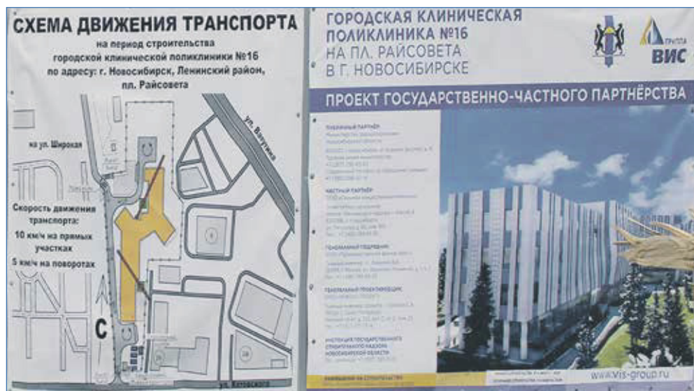
Паспорт объекта, размещенный со стороны ул. Котовского