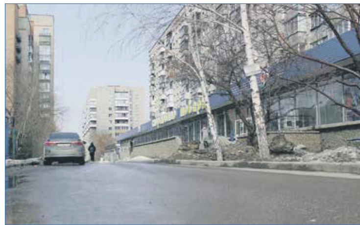
Новый асфальтированный проезд за домом Котовского, 52

гимназии, между зданиями детского сада №445 и ГБУ «Клинический центр охраны здоровья семьи и репродукции», от улицы Пермская в сторону дома Киевская, 16, от пешеходной дорожки вдоль забора школы №92 перед домом Киевская, 9 к тротуару вдоль улицы Пермская.