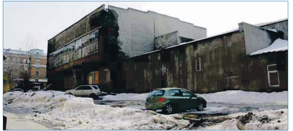
Здание бывшего ДК им. Клары Цеткин

Важно, что фиксация адреса «ул. Котовского, 19» непосредственно в бюджете