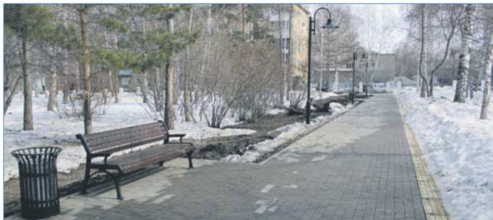
Одна из пешеходных дорожек в сквере им. Гагарина

Дополнительно к адресам, где проведено комплексное благоустройство, были установлены элементы детских и спортивных площадок во дворах домов Станиславского, 2, 3 и 4/3; 2-й переулок Пархоменко, 13; Киевская, 2 и 12; Пархоменко, 72, (наказ по этому адресу выполнен при поддержке депутата Законодательного собрания по территории).