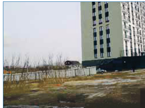
Земельный участок по ул. Широкая, присоединяемый к Парку им. Кирова

По ремонту дорог: улица Котовского и 1-й переулок Пархоменко в границах домов 8–16.