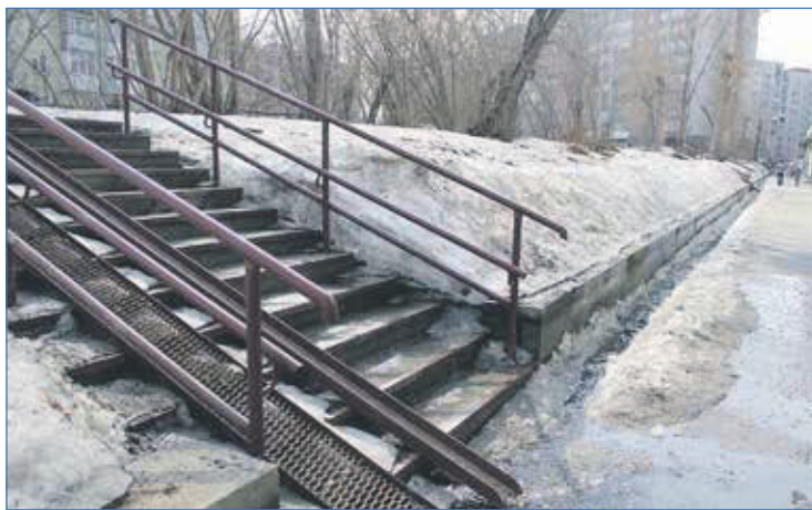
Подпорная стенка, водоотводной лоток и лестница на Котовского, 40

Обустройство пешеходных дорожек перед домом Котовского, 26, с торца дома Котовского, 32, за домом Котовского, 50, от дома Широкая, 21/1 к улице Широкая, вдоль дома Пархоменко, 78, между 1-м и 5-м подъездами и за аркой дома Пархоменко, 72, от арки дома Киевская, 2 к зданию Второй Новосибирской