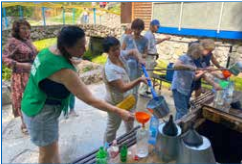
У святого источника в п. Ложок