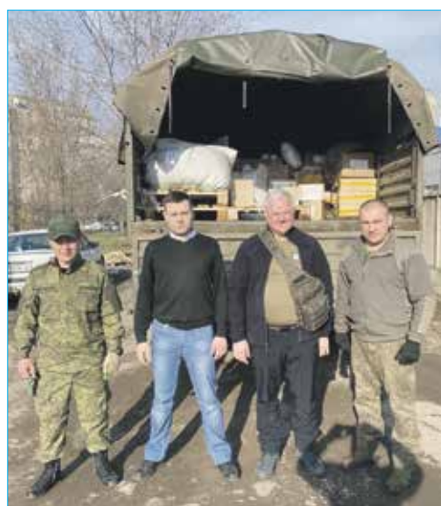
Передача гуманитарной помощи в ЛНР

— В этом году мы решили не проводить масштабных празднеств в целях экономии ре-