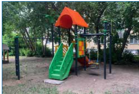
Новый детский городок, Красный проспект, 81/1