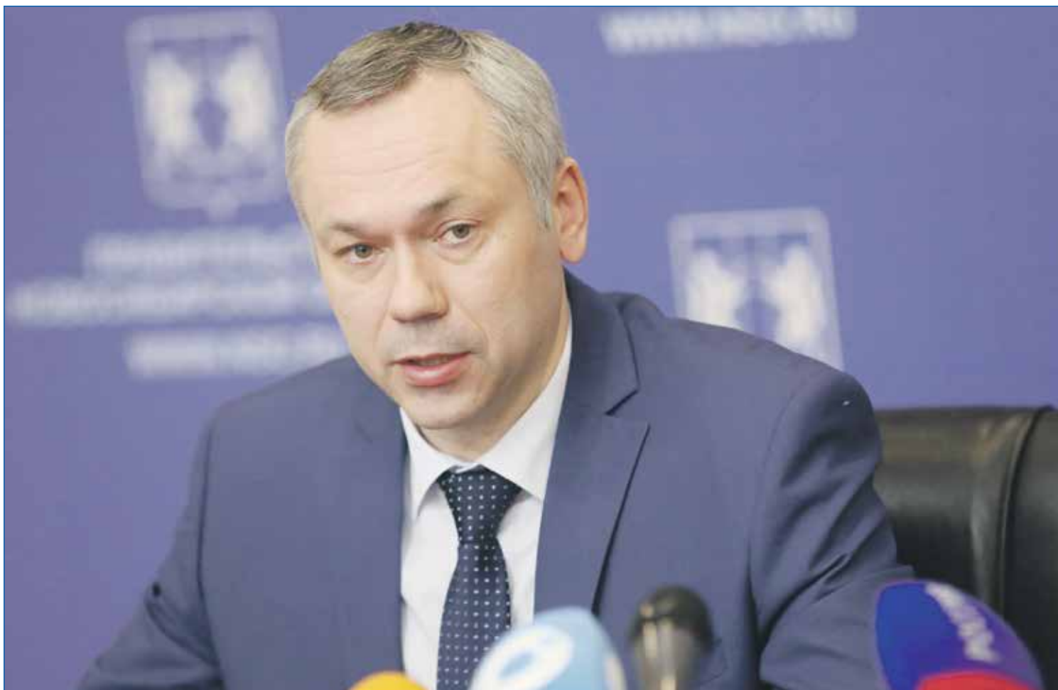
Андрей Травников, губернатор Новосибирской области