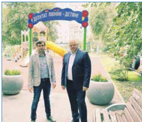
Новая детская площадка, ул. Жуковского 106а

В благоустройстве придомовых территорий, касаемо установки игровых элементов, спортивных площадок, детских площадок, очень хорошо помогает губернаторская программа «Территория детства». И благодаря этой программе мы в этом году по адресу: Линейная, 33\1, реализуем крупный проект. На придомовой территории устанавливаем не просто единичные тренажеры и карусели, а делаем некий спортивный городок с волейбольным полем, ограждениями, лавочками и тренажерами для армрестлинга.