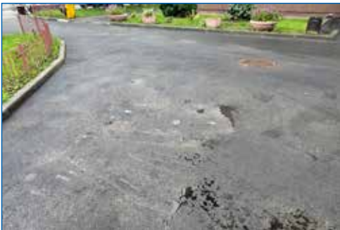
Новый асфальт, ул. Тимирязева, 58/1