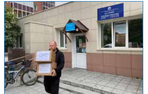
Погрузка гуманитарной помощи в зону СВО