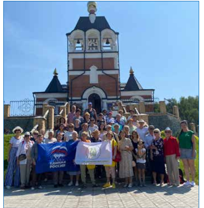
Экскурсия в п. Ложок