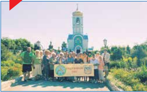
«Поездки по святым местам». Экскурсия в Кольвань