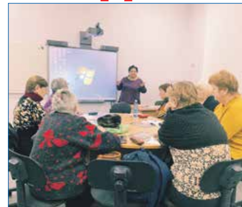
Курсы компьютерной грамотности

— Я работаю в двух комиссиях. Заместителем председателя постоянной комиссии по научно-производственному развитию и предпринимательству и являюсь членом постоянной комиссии по местному самоуправлению. Что касается комиссии по предпринимательству, то пример одного из направлений