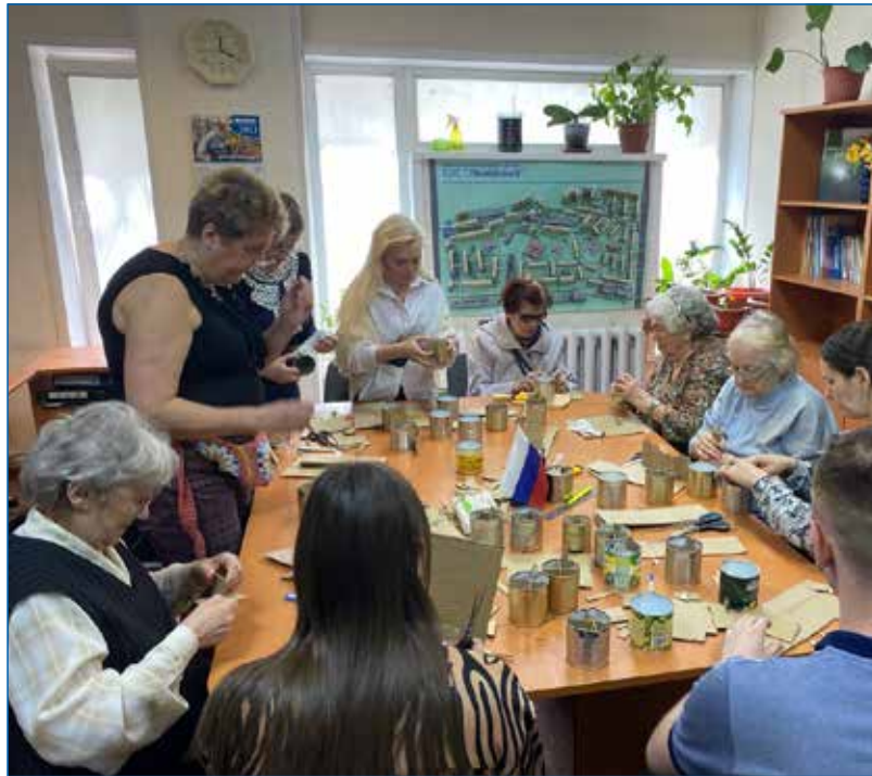
Изготовление окопных свечей