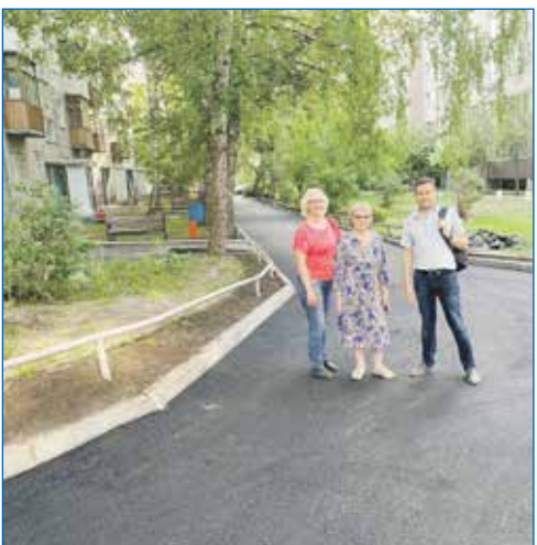
Новый асфальт на ул. Кропоткина

В благоустройстве придомовых территорий, касаемо установки игровых элементов, спортивных площадок, детских площадок, очень хорошо помогает губернаторская программа «Территория детства». И благодаря этой программе мы в этом году по адресу: Линейная, 33\1, реализуем крупный проект. На придомовой территории устанавливаем не просто единичные тренажеры и карусели, а делаем некий спортивный городок с волейбольным полем, ограждениями, лавочками и тренажерами для армрестлинга.