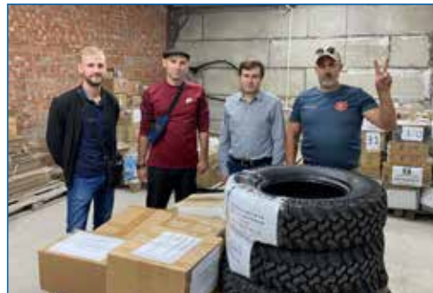
Отправка гуманитарной помощи в зону СВО