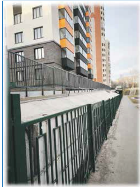
Отремонтирована подпорная стена, ул. Немировича-Данченко, 16/3

идеей для своего дома или микрорайона, и получить на реализацию проекта из городского бюджета до 1 миллиона рублей. И документация несложная, но нужно активно в это включиться, приложить личные усилия. А это уже сложнее... Может быть, поэтому много лет программа была почти не востребована.