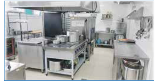
Отремонтированная кухня в школе №15 (ул. Немировича — Данченко, 20/2)

— Вот с кем никогда не было проблем, так это с ними. У меня на округе три ТОСа. И их активность и инициативность всегда на высоте. В моей приемной начинается утро, они уже здесь и готовы брать на себя решение, по сути, наших общегородских задач, проблем дома, микрорайона. Я горжусь, что рядом есть такие неравнодушные, легкие на подъем жители! А еще, конечно, Совет ветеранов. Для меня — это святые люди. Если не мы, то кто?