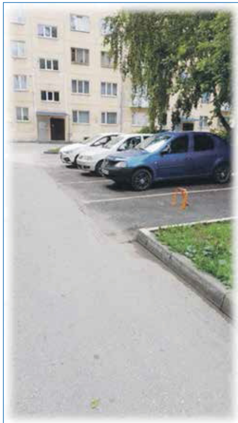
Благоустройство парковочных карманов, ул. Немировича-Данченко, 4/2

стучаться до жителей, они должны стать партнерами, а сейчас преобладает иждивенческая позиция: мы платим налоги, вы — власть, вы и делайте, вы должны и обязаны. К примеру, есть у нас в городе программа инициативных проектов. Когда любой человек может выйти с интересной и полезной