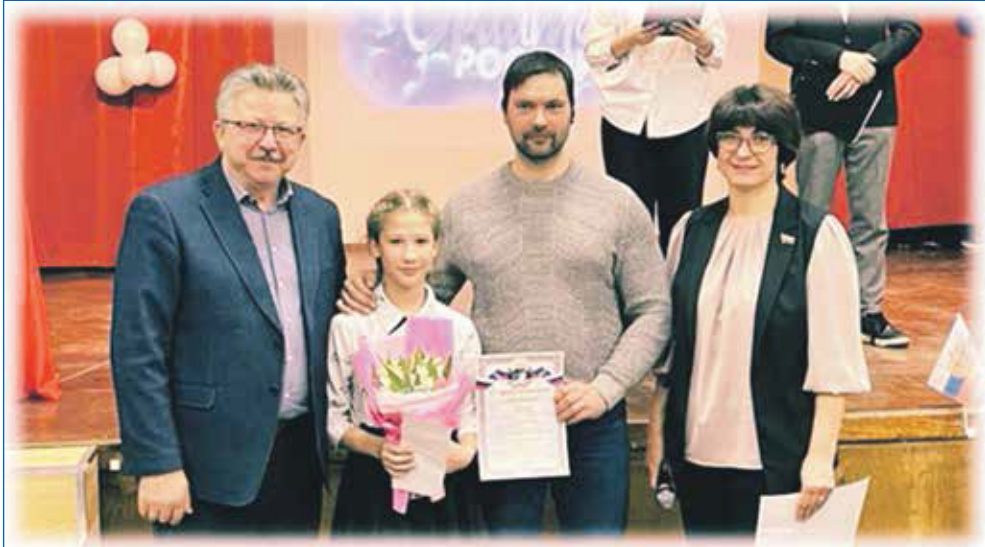
Вручение депутатской стипендии