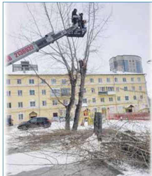
Снос аварийных деревьев, 3-й пер. Крашенинникова, 12