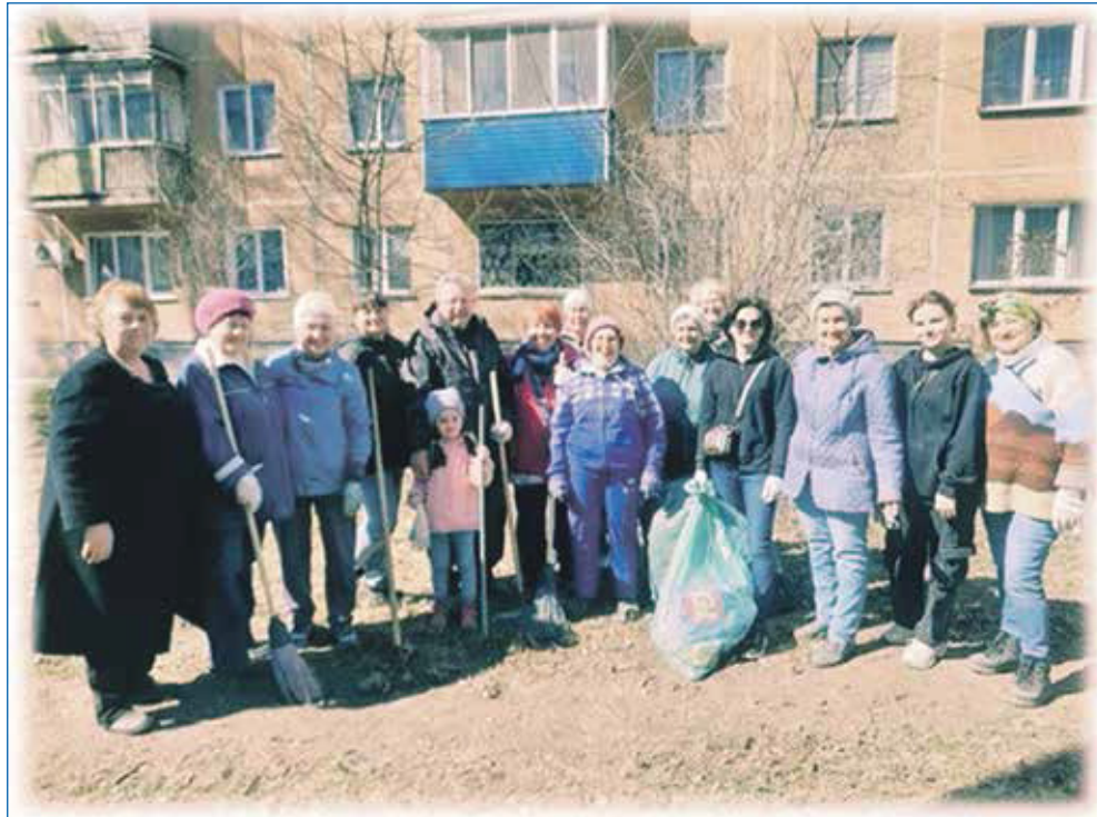
Субботник на округе №28

— Могу сказать, что здесь все непросто. Инициативность людей я бы отметил где-то на твердую «четверку». Надо до-