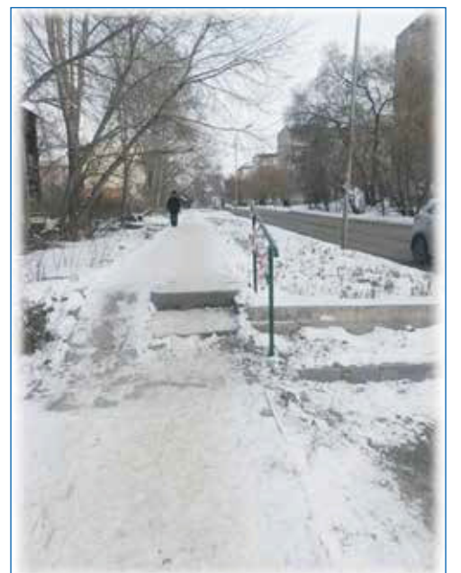
Установка поручней у лестницы напротив дома по ул. Степная, 46

Крашенинникова, 6, 3-й пер. Крашенинникова, 12, ул. Крашенинникова, 11, ул. Петропавловская, 9, ул. Троллейная, 37.