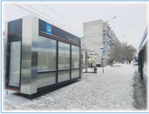
Конечный остановочный пункт ЖМ «Станиславский»

— Что еще требует решения, но на данный момент это сделать сложно?