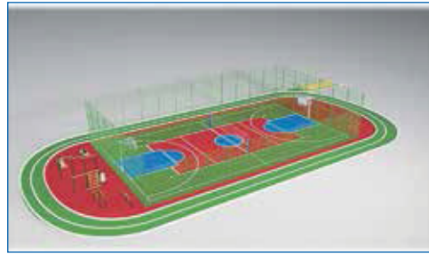
Школа №20 после капитального ремонта и проект нового стадиона

— Яркий пример — благоустройство территории на Титова, 43/1 в 2024 году. В наполнении площадки для спорта и отдыха мы учли пожелания и детей, и взрослых. Получилось уникальное пространство с резиновым покрытием и множеством игровых и спортивных элементов, где мо-