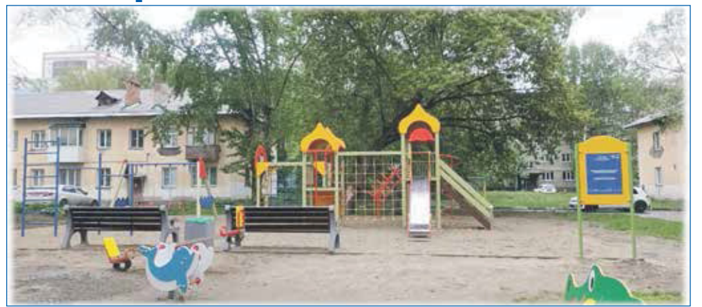
Детская площадка, ул. Степная, 54/1

ния, спил аварийных деревьев, асфальтирование территории;