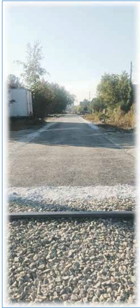
Преобразившаяся улица Петропавловская

Чтобы выполнять самые сложные финансово емкие наказы, мы с коллегами за эти годы выработали достаточно действенный механизм: объединяем усилия депутатов Заксобрания региона и го-