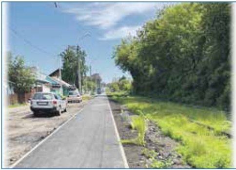
Благоустройство тротуара по ул. Вертковская вдоль трамвайной линии