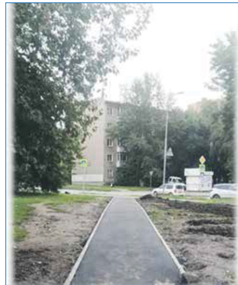
Асфальтирование тропинки к дому по ул. Тихвинская, 8