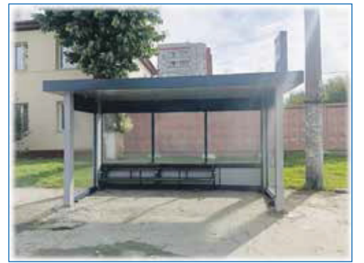
Новосибирску нужны качественные, красивые и удобные остановочные пункты

Еще одна проблема — это частный сектор, о котором говорится очень мало. А ведь люди хотят жить в комфортных условиях не только в многоэтажных домах. Но картина, которую мы зачастую наблюдаем в частном секторе, удручает: колдобины на дорогах, отсутствие тротуаров и освещения. Сейчас заработала дорожная карта по безопасным школьным маршрутам, что способствует развитию инфраструктуры частного сектора. Постепенно решаются вопросы с пешеходными пространствами и освещением улиц. Ведь это вопросы безопасности, и прежде всего, наших детей. Радует, что в городе стали появляться тротуары там, где никогда раньше не ступала нога чиновника.