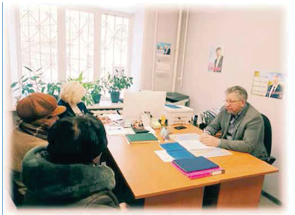
Прием граждан депутатом в общественной приемной по адресу ул. Степная, 54/1

мерно по 60 тысяч избирателей. У каждого из нас была колоссальная нагрузка. Я работал в системе соцзащиты практически с момента ее формирования — после выхода в 1993 году указа Президента о создании органов социальной защиты в России. И пришел в городской Совет с пониманием многих процессов, которые в тот момент были необходимы представительной ветви власти. Тогда этого очень не хватало для принятия правильных решений по организации качественной помощи населе-