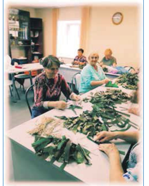
Работа по помощи военным на СВО на округе ведется на постоянной основе

— Когда я первый раз избирался, то часто слышал, мол, вот мы вас сейчас выбираем, а потом вас днем с огнем не сыщешь. Я еще тогда сказал, что сломаю этот стереотип о недоступности депутатов. Мои приемные работают полный рабочий день, а не только в определенные часы. Я лично встречаюсь с жителями дважды в месяц в рабочем порядке. Также у нас юрист дает бесплатные консультации. И всегда говорю: депутат — это не царь, не Бог, не волшебник, но я стараюсь делать все, что в моих силах, чтобы решить проблему.