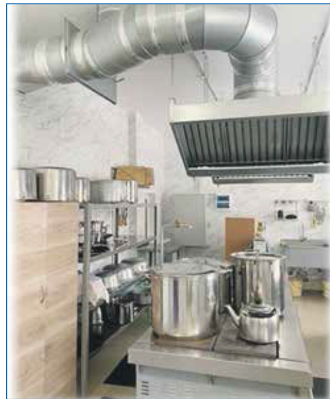
В детском саду №360 появился новый пищеблок