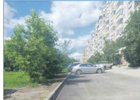
Новые парковки по адресу ул. Троллейная, 41

■ Установлены искусственные неровности по адресам: ул. Ударная, 27, ул. Танкистов, 3, к дому 3/1.