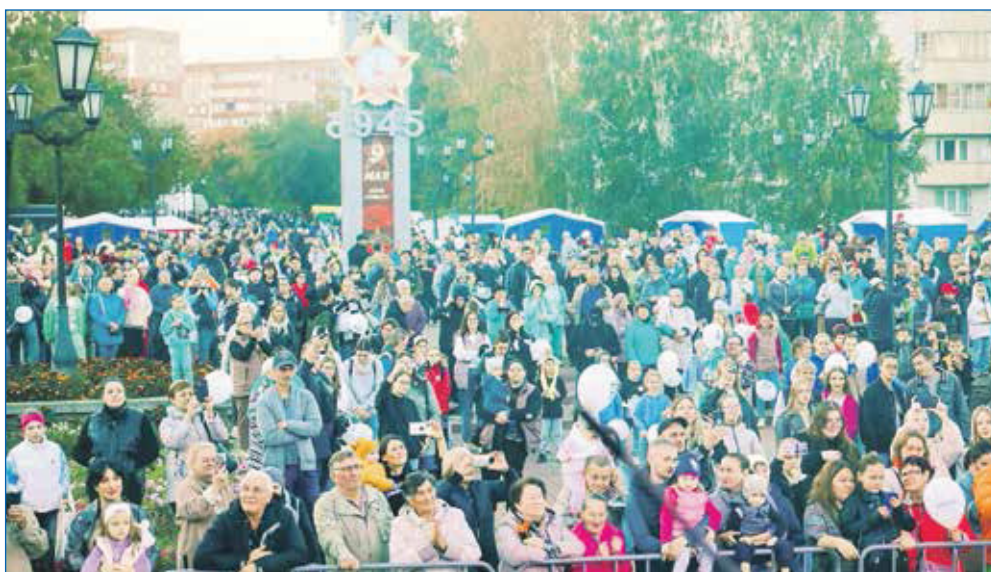
Празднование 50-летия Юго-Западного жилмассива