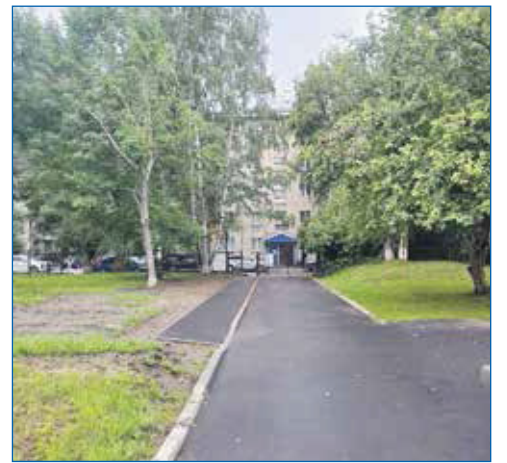
В школе № 188 было выполнено несколько наказов, связанных с благоустройством

— Я сама из социальной защиты, и мое кредо — помогать людям — идет со мной по жизни. Мой телефон знает, наверное, каждый второй в округе. Звонят в любое время: будни, выходные — неважно. Я всегда стараюсь лично разобраться в ситуации, прощупать почву, поддержать. Для меня важно быть рядом с людьми, особенно когда они попадают в трудные ситуации. Они должны знать, что не одни. Поэтому мой принцип прост: если кому-то нужна помощь, то я — рядом.