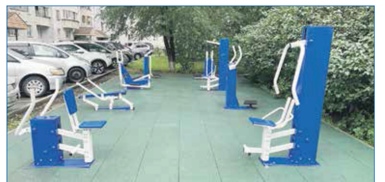
Установка тренажеров по ул. Троллейная, 142