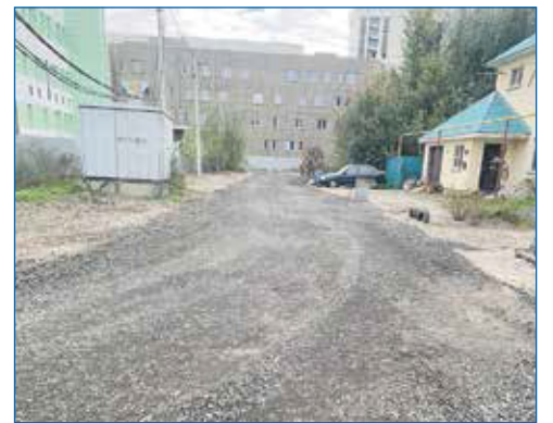
Отсыпка дорог частного сектора

Субботники мы проводим на самых запущенных муниципальных территориях, чтобы хоть как-то их привести в порядок. Но кто в итоге приходит? ТОСы, активисты, общественники. Остальные... просто проходят мимо. И мало того, так еще и продолжают мусорить. Очень ярко это заметно на детских площадках на муниципальных