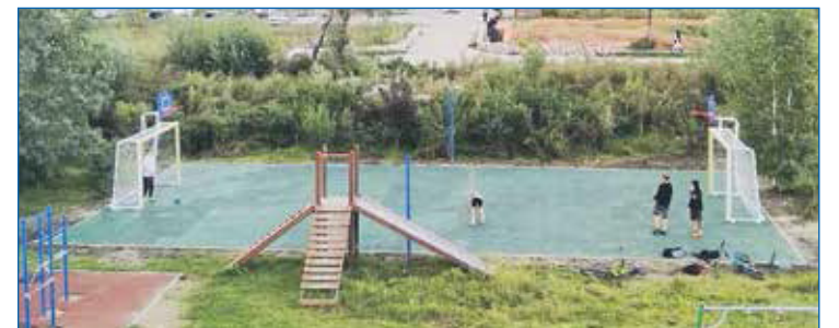
Установлена спортивная площадка в частном секторе по улице Смородиновая