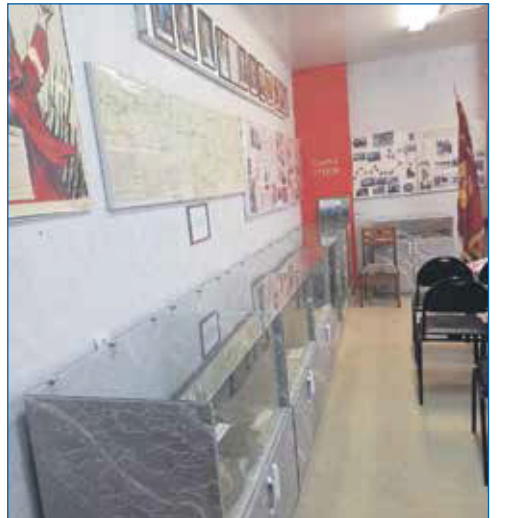
Приобретение мебели в музей школы № 48

■ По заявлениям жителей увеличено время для пешеходов на светофоре у школы № 48.