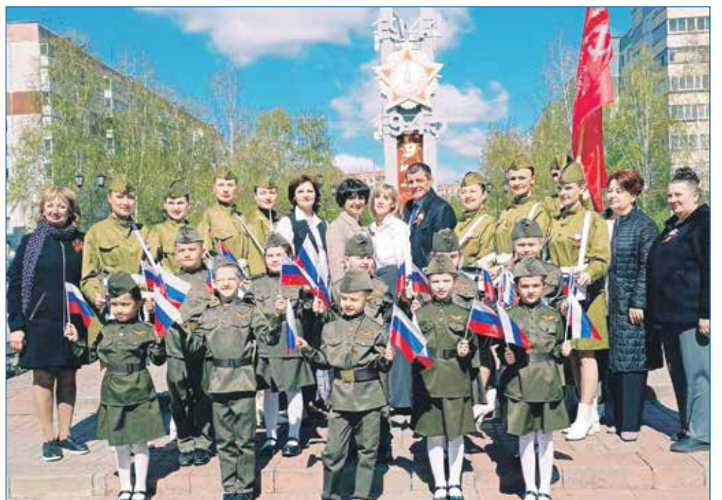
Парад детских садов на Бульваре Победы