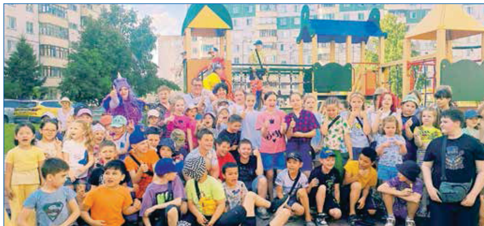
Открытие детской площадки по адресу ул. Тrolleyная, 144

граждан выполнено. Для меня это хороший показатель. К сожалению, остаются нереализованными самые затратные наказы: строительство и реконструкции школ, строительство канализации в частном секторе, крупные инфраструктурные объекты. На их реализацию нужны десятки, а то и сотни миллионов рублей. Одному лишь городскому бюджету такие суммы