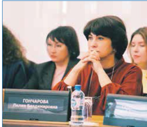
Работа депутата на комиссиях и сессиях в Совете депутатов города Новосибирска

Еще одна хорошая новость: появился инвестор, готовый построить на Юго-Западном жилмассиве крупный спорткомплекс с залами для борьбы, с катком и полем для мини-футбола. Правда, пока идут дебаты по подъездным путям. Дело в том, что участок для этого комплекса находится внутри жил-