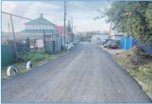
Наказ по асфальтированию улицы Тульской от дома №306 до №417

■ Произведен ремонт дороги по ул. Ударной от дома №35 до №115, по 1-му Степному переулку; по 1-му Кавказскому переулку; по 2-му Степному переулку; по 2-му Кавказскому переулку; по ул. Крымской; по ул. Херсонской; по ул. Степной от ул. Пермской до ул. Связистов, от ул. Связистов до ул. Бийской; по переулкам Бийским; по ул. Окинской; по 2-й, 3-й, 4-й Окинским улицам; по 1-му, 2-му, 3-му Амурским переулкам; по ул. Оборонной; по 2-му Пермскому переулку; по ул. Ашхабадская, участок по ул. Пушкарева, от ул. Оборонная до ул. Волховская.