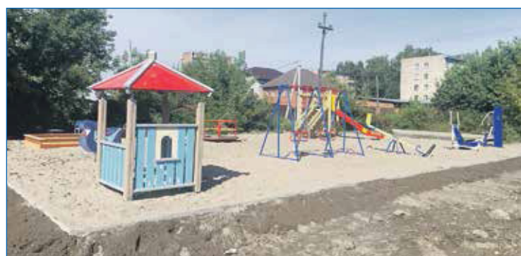
Детская площадка по адресу ул. Тульская, 311а

■ Благоустройство придомовых территорий: ул. Троллейная, 142, 146, ул. Ударная, 19, 29, ул. Курганская, 26, 38.