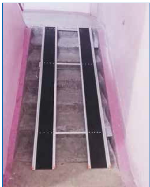
Пандусы в подъездах устанавливали по просьбам жителей

■ Благоустройство парковок: ул. Троллейная, 41, ул. Троллейная, 142, 146, ул. Ударная, 19, 29, ул. Курганская, 22, 26, ул. Полтавская, 21.