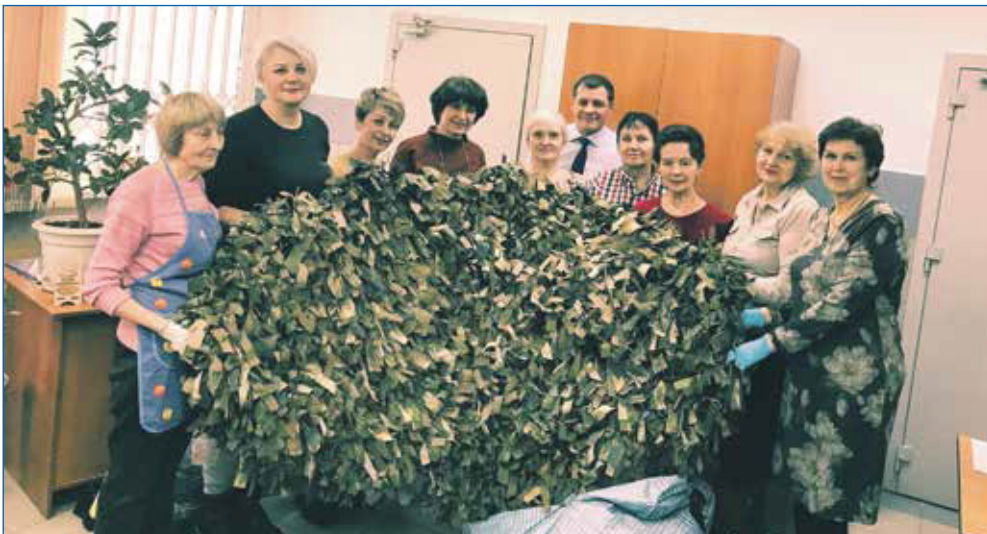
Помощь военнослужащим на СВО на округе №34 ведется на постоянной основе