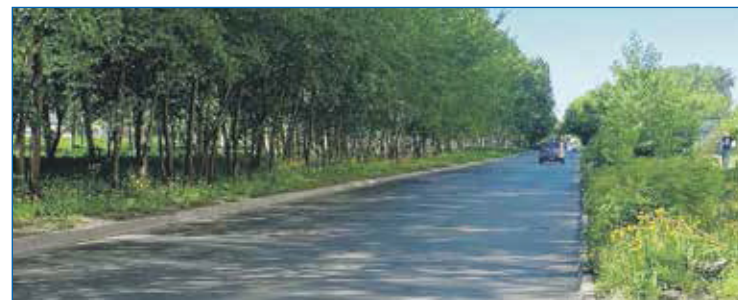
Капитальный ремонт улицы Малая Троллейная в рамках исполнения наказов

ул. Титова, 198/1: в первый понедельник месяца с 12:00 до 16:00 без предварительной записи ул. Станиславского, 40: во второй вторник месяца с 14:00 до 17:00 без предварительной записи ул. Связистов, 139/1: в третий понедельник месяца с 14:00 до 17:00 без предварительной записи