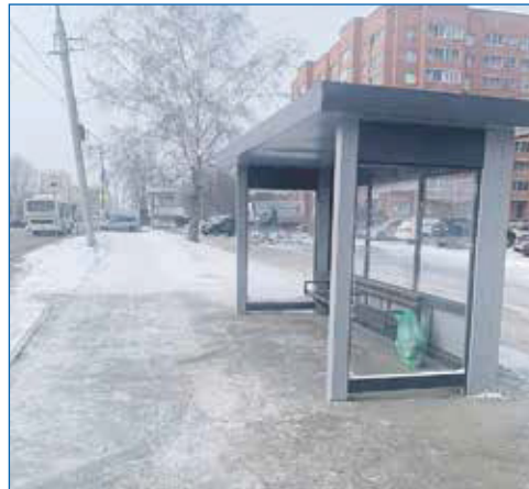
Новый остановочный павильон «Ул. Танкистов»

Еще одна большая тема — это водопроводы в частном секторе. Большинство сетей уже устарело и их нужно менять, причем, делать это очень активно. Старые трубы рвутся постоянно. Это уже не ремонт, а бег по кругу.