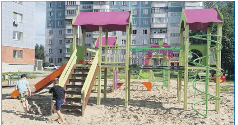
Детская площадка по адресу ул. Пермская, 59