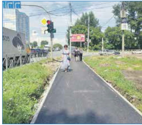
Ремонт тротуара вдоль улицы Троллейной в рамках исполнения наказов

■ Произведено асфальтирование улицы Тульская от дома 306 до дома 431, участка ул. Танкистов.