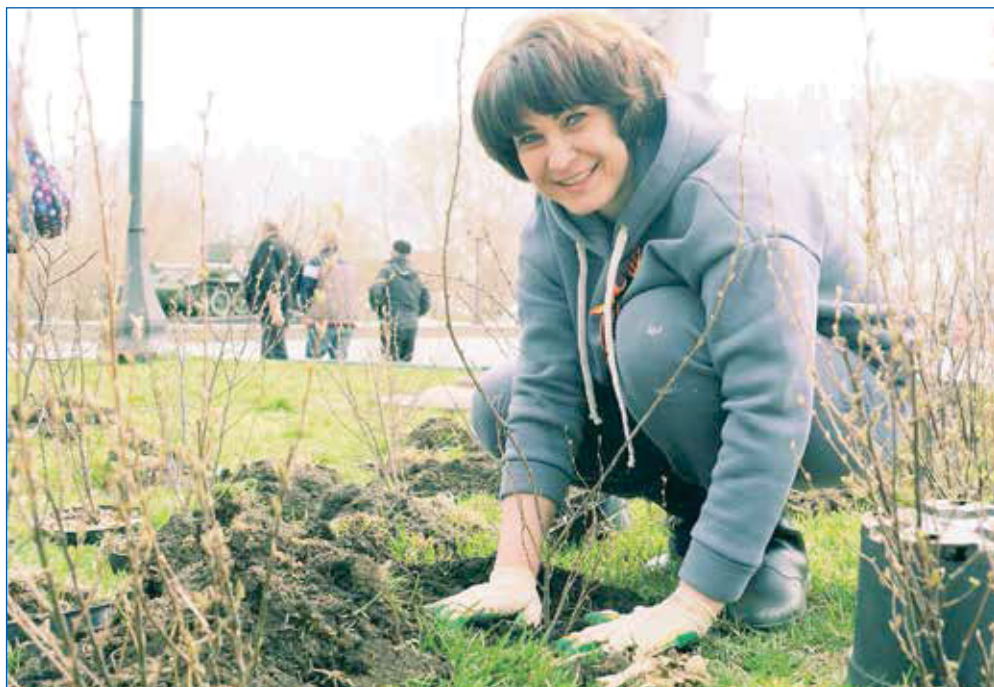
Озеленение Бульвара Победы

— Всего в 2020 году у меня было около 400 наказов плюс порядка 50 перешло от предыдущих созывов. Радует, что по линии образования удалось сделать очень многое и реализовать почти все наказы. Это ремонт школ, детских садов, установка нового оборудования, капитальный ремонт кровель в нескольких школах, замена оконных блоков в школах и детских садах, обновление рекреационных зон, замена полов в рекреаци-