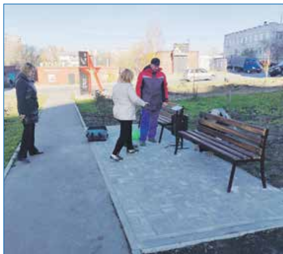
Работы в сквере имени Федора Ивановича Толбухина