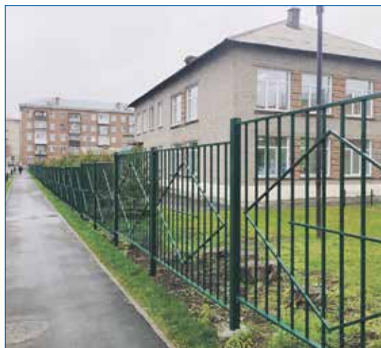
Ограждение детсада №281