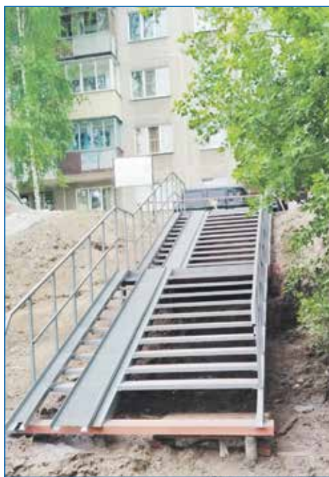
Лестничный спуск во дворе дома №27 на Гусинобродском шоссе