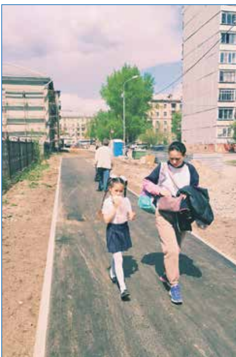
Тротуар вдоль улицы Даурской к школе №82