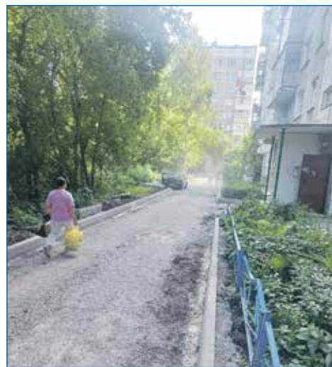
Асфальтирование двора дома №13 на Гусинобродском шоссе