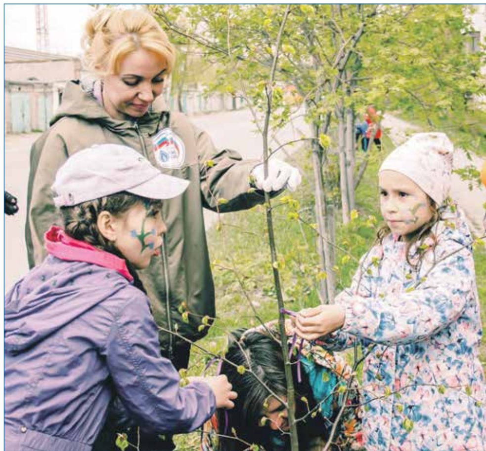
В Дзержинке часто проводят субботники