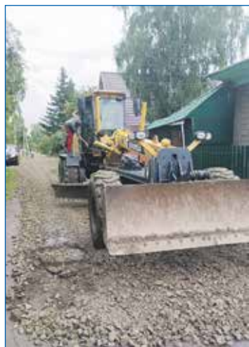
Отсыпка улицы Зеленхозовской