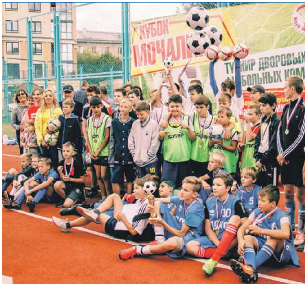
Один из спортивных турниров

Это еще раз подтверждает, что вместе мы можем многое, вместе — мы сила!