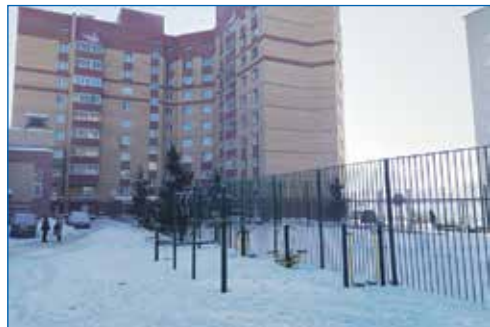
Ограждение спортивной площадки на улице Королева, 10/1