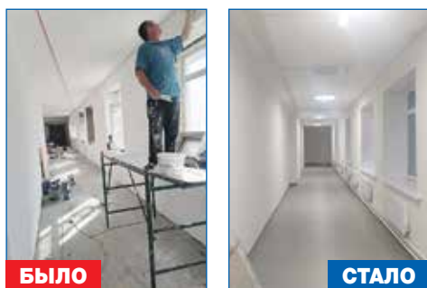
Ремонт коридора бассейна школы №189

● Производство работ по организации парковочных карманов во дворе дома №119 по ул. Выборная