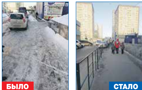
Установка ограждения на проезжей части для безопасного пешеходного движения вдоль территории дома №118 по ул. Выборная

● Строительство спортивной и детской площадки на территории дома №97 по ул. Выборной с прорезиненным покрытием и ограждением