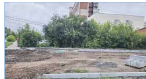
Обустройство парковки у школы №206 со стороны ул. Проезд Сталя Шмакова

● Установка ограждения пешеходной дорожки вдоль дома №108 по ул. Выборная к МКДОУ №458