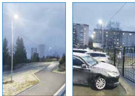
Организация освещения территории детского сада №70

● Выполнение работ по освещению ул. Проезд Сталя Шмакова