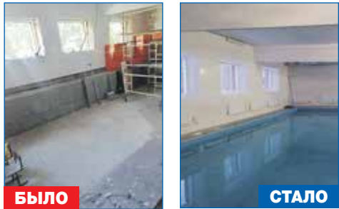
Ремонт бассейна школы №189

● Выполнение работ по строительству тротуара по нечетной стороне от ул. Выборная, 131/2, до ул. Выборная, 163