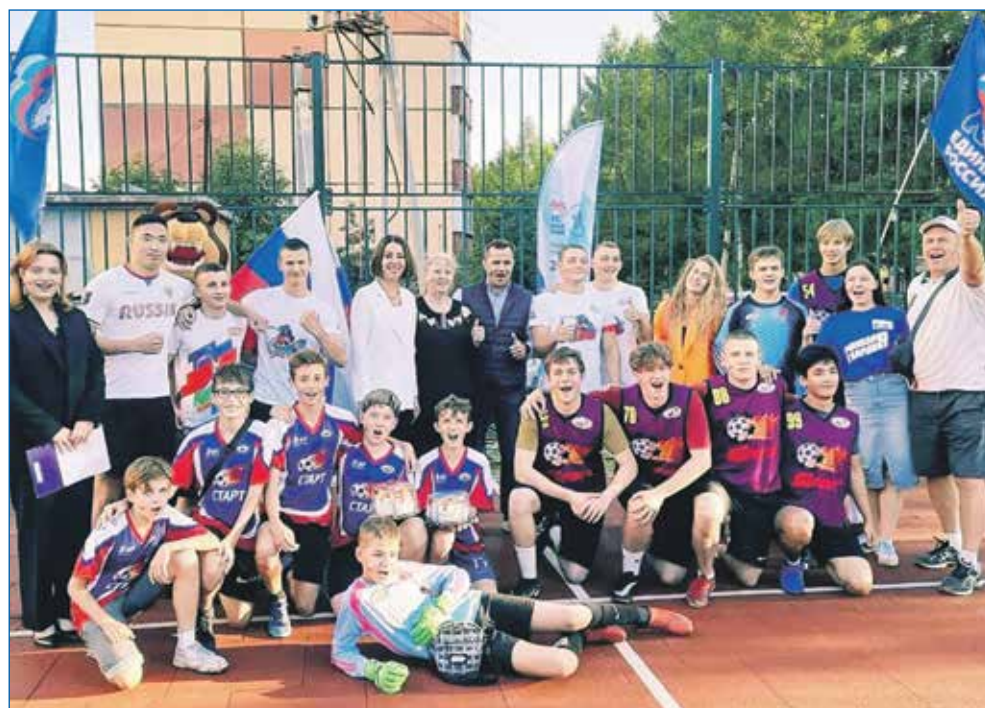
Юные участники соревнований на округе №35 в День Государственного флага России

Не вызывает сомнения, что после выборов Президента РФ нам будут представлены обновленные цели и задачи развития страны, программы разрешения сложившихся проблем, этого неизбежно требуют те условия и обстоятельства, в которых оказалась Россия. Новосибирск, круп-