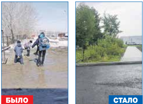
Выполнение благоустройства территории у школы №206 со стороны ул. Проезд Сталя Шмакова

● Выполнение благоустройства территории у МБОУ СОШ №206 со стороны ул. Проезд Сталя Шмакова: обеспечение независимого проезда к МБОУ СОШ №206, строительство парковки для автомобилей со стороны ул. Проезд Сталя Шмакова, строительство тротуара около 20 метров от тротуара вдоль ул. Проезд Сталя Шмакова до калитки школы