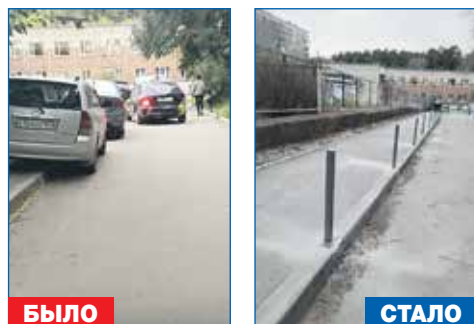
Установка ограждения пешеходной дорожки вдоль дома №108 по ул. Выборная

● Осуществление ремонта дорожного покрытия улиц Кленовая и Рябиновая, выполнение благоустройства улиц, обустройстволивневной канализации и тротуаров