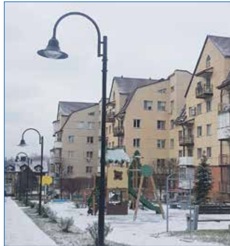
Благоустройство микрорайона Зеленый бор по программе «Комфортная городская среда»

● Установка спортивной площадки с тренажерами, спортивным комплексом и прорезиненным напольным покрытием во дворе дома №99/4 по ул. Выборной