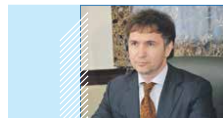
Дмитрий АСАНЦЕВ, Председатель Совета депутатов города Новосибирска:

Для такой страны, как Россия, существование без суверенитета невозможно, ее просто не будет, во всяком случае, в том виде, в котором она сегодня существует и в котором существовала тысячу лет. Поэтому главное — укрепление суверенитета. Но это очень широкое понятие. Укрепление суверенитета внешнего, это значит — укрепление обороноспособности страны, безопасности по внешнему контуру, это укрепление общественного суверенитета. Это безусловное обеспечение прав, свобод граждан страны, развитие нашей политической системы, парламентаризма. И наконец, это обеспечение безопасности и суверенитета в сфере экономики и технологического суверенитета.