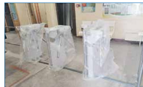
Установка турникетов в школе №206

● Установка турникетов в МБОУ СОШ №206, организация пропускной системы