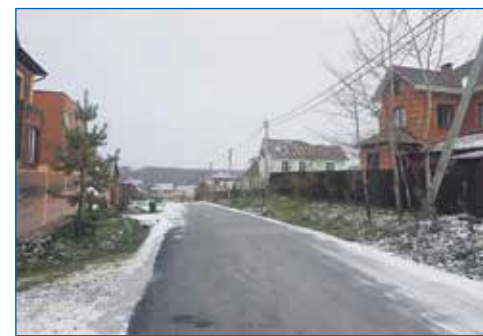
Ремонт асфальтового покрытия на ул. Кленовая

● Установка детской игровой площадки (от года до 10 лет) с напольным покрытием «резиновая крошка» во дворе дома №127 по ул. Выборной