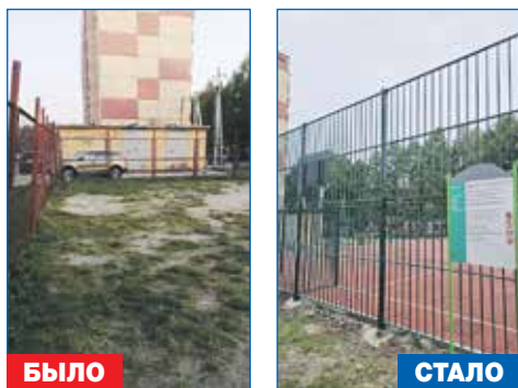
Спортивная площадка для игры в мини-футбол у дома №18 по ул. Ключ-Камышенское плато: обустройство мягкого покрытия

● Выполнение работ по благоустройству пешеходного перехода ул. Рябиновая по адресу ул. Выборная, 163, ост. «Стенд»: организация перехода видимым для водителей, установка знаков над дорогой «Пешеходный переход», знаков, ограничивающих скорость движения транспорта, нанесение на дорогу разметки «Дети идут в школу»