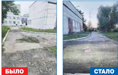
Строительство тротуаров на территории школы №206

● Строительство тротуаров на территории МБОУ СОШ №206