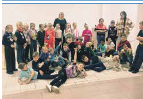
Организация экскурсий учащихся школ