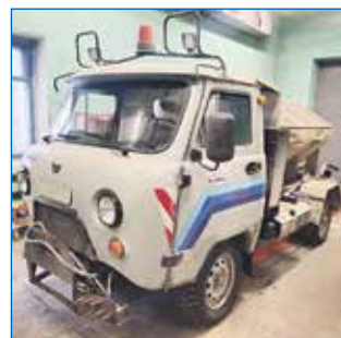
Ремонт автомобиля МКУ «Дзержинка»