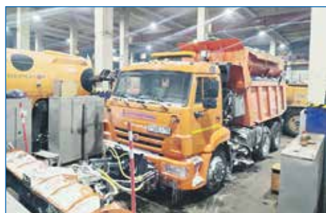
Приобретение запасных частей для техники МКУ «Дзержинка»