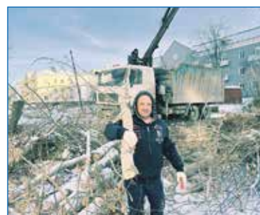
Снос деревьев на муниципальной территории, ул. Д. Давыдова, 7