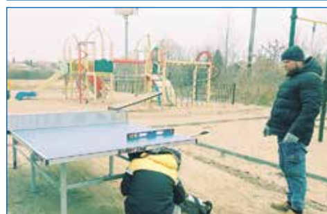
Теннисный стол, ТОС «Коминтерна»