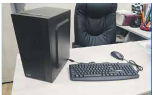
Приобретение системного блока в ДМШ № 3