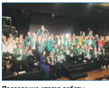
Подведение итогов работы трудовых отрядов Дзержинского района