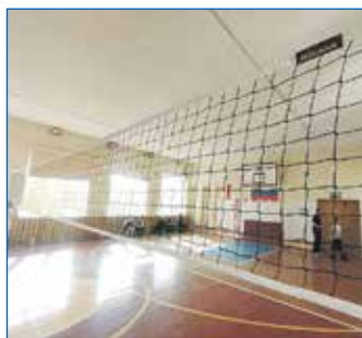
Приобретение волейбольной сетки для школы № 36