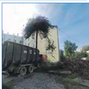
Снос деревьев, ул. Авиастроителей, 4