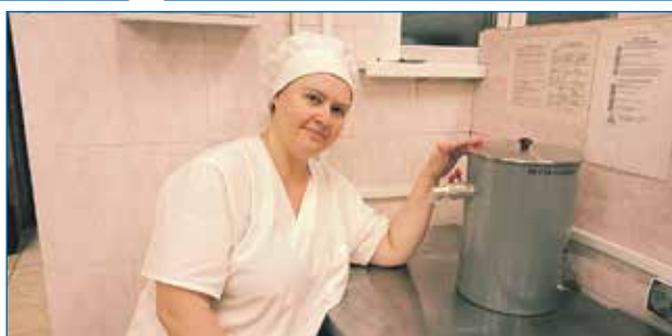
Приобретение кипятильника, детский сад № 493