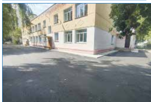
Замена асфальта, детский сад № 163