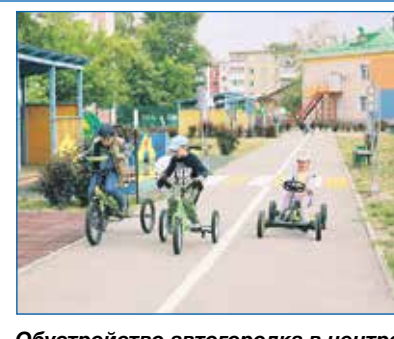
Обустройство автогородка в центре «Олеся»