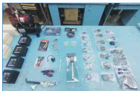
Приобретение деталей для КЮТ, молодежный центр «Звёздный»