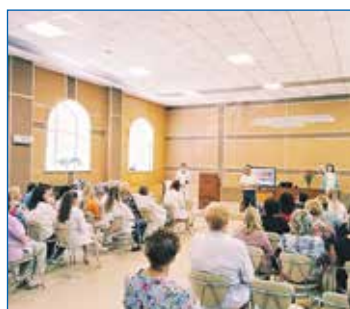
Поздравление с Днём медика, ДГКБ № 6