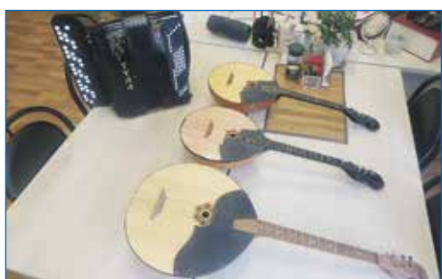
Приобретение музыкальных инструментов для детской музыкальной школы № 3