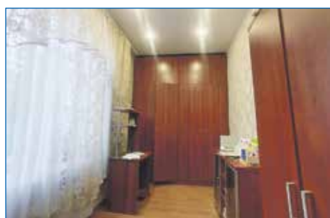
Ремонт кабинета логопеда, детский сад № 381