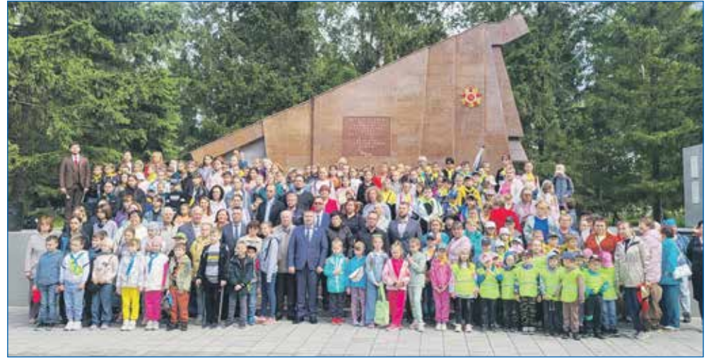
22 июня - День памяти и скорби