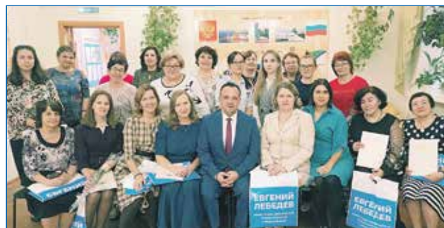
Поздравление коллектива детского сада № 430