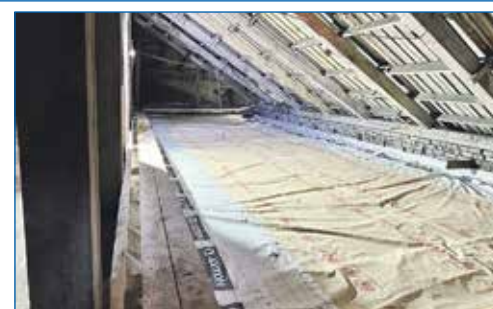
Ремонт крыши ДДК им. М. И. Калинина