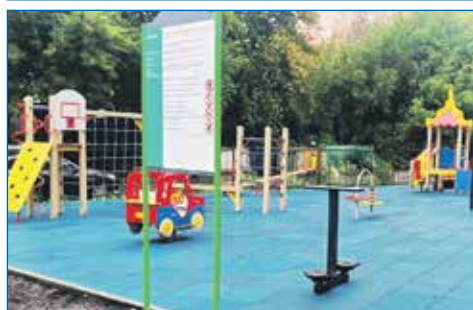
Дополнение элементами детской площадки, ул. 25 лет Октября, 8