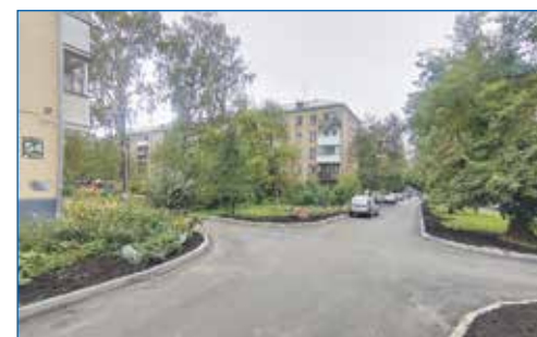
Ремонт внутриквартальной дороги домов на ул. Трикотажная