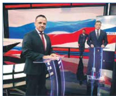
Кандидат на выборах губернатора