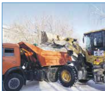
Вывоз снега, детский сад № 381