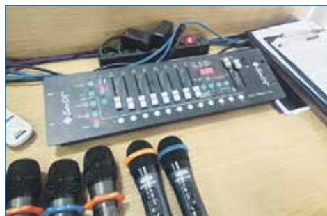
Приобретение звукового оборудования для актового зала школы № 169