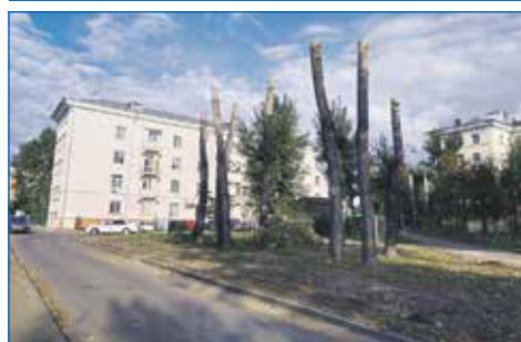
Кронирование деревьев, ул. Авиастроителей, 3