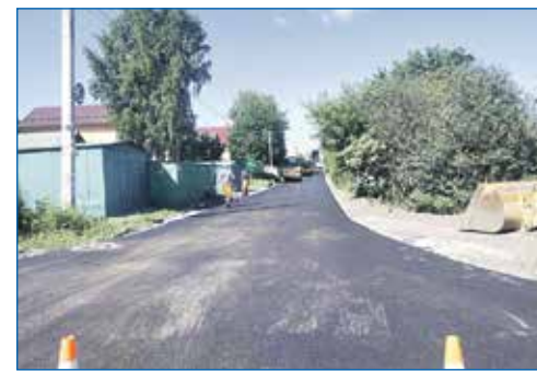
Ремонт в асфальте ул. Писарева