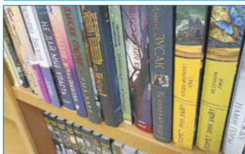
Пополнение новыми книгами библиотек Дзержинского района