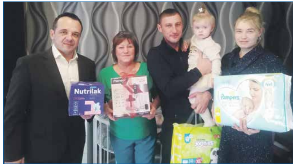
Поддержка молодых многодетных семей

— На реализацию каких планов развития округа вы рассчитываете в период до завершения сроков работы в нынешнем составе Совета депутатов города Новосибирска?