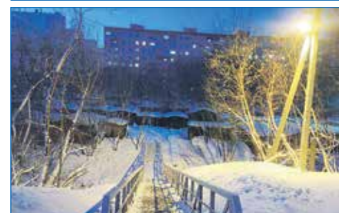
Обустройство уличного освещения у моста, ул. Д. Давыдова, 7