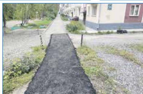
Асфальтирование дорожки, ул. Трикотажная, 54