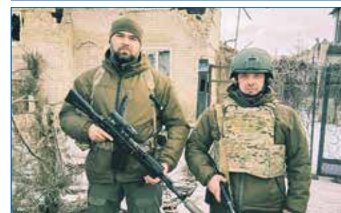
Участие в СВО (волонтёр)