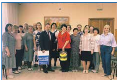
Поздравление коллектива детского сада № 395