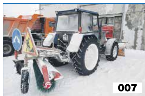
Приобретение запасных частей для техники МКУ «Дзержинка»