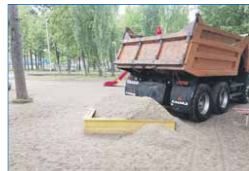
Доставка песка в сквер им. М. И. Калинина