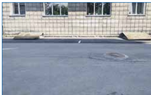
Установлено 15 новых окон в библиотеке им. В.П. Чкалова