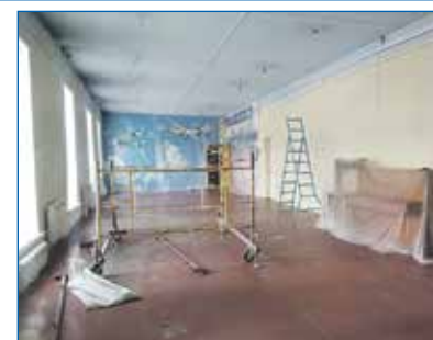
Ремонт помещения библиотеки им. В. П. Чкалова