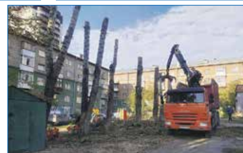
Кронирование деревьев, ул. Д. Давыдова, 26, 2в