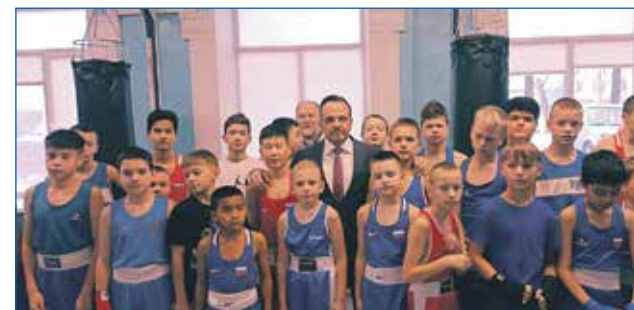
Поддержка Сибирской школы бокса, детско-юношеского центра «Старт»