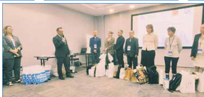
Награждение победителей конкурса молодых специалистов