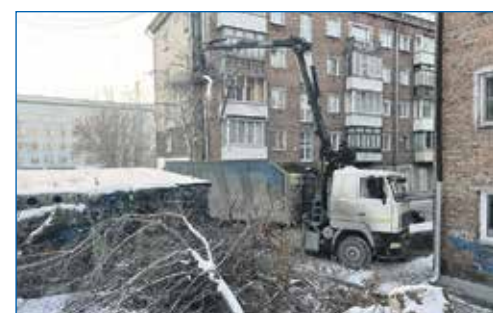
Кронирование деревьев, ул. Авиастроителей, 1/7