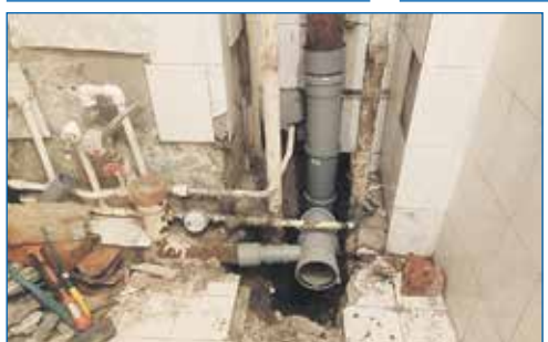
Устранение подтопления поликлиники, ул. Гоголя, 225/1