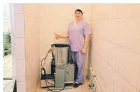
Приобретение картофелечистки, детский сад № 493