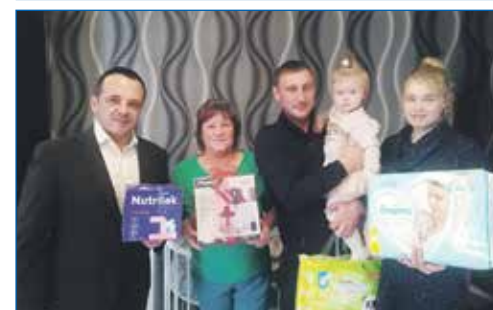
Поддержка молодых многодетных семей