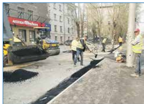
Ремонт тротуара по ул. Авиастроителей