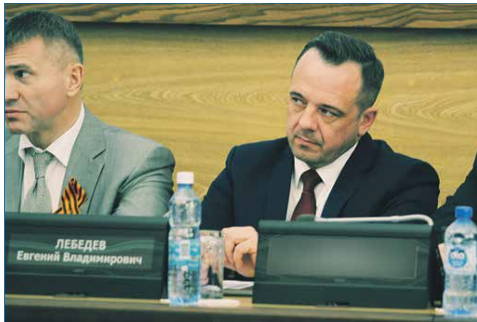
На сессии Совета депутатов города Новосибирска