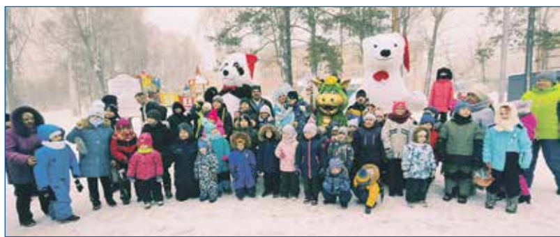
Проведение уличных мероприятий для жителей