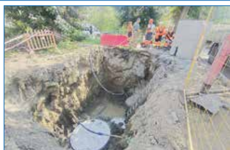
Подведение ХВС в ДМШ № 3