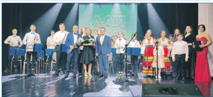
5-летие оркестра «Sib-brass»