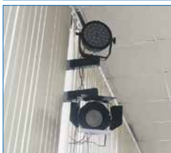
Приобретение светового оборудования для школы № 169