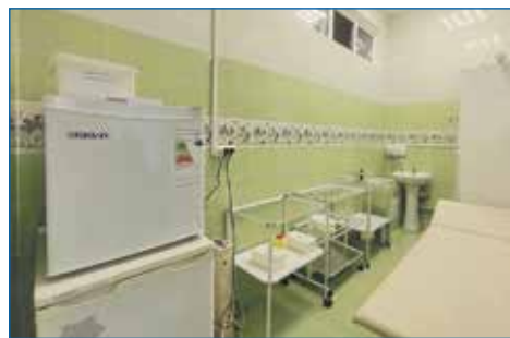
Ремонт медицинского кабинета, детский сад № 381