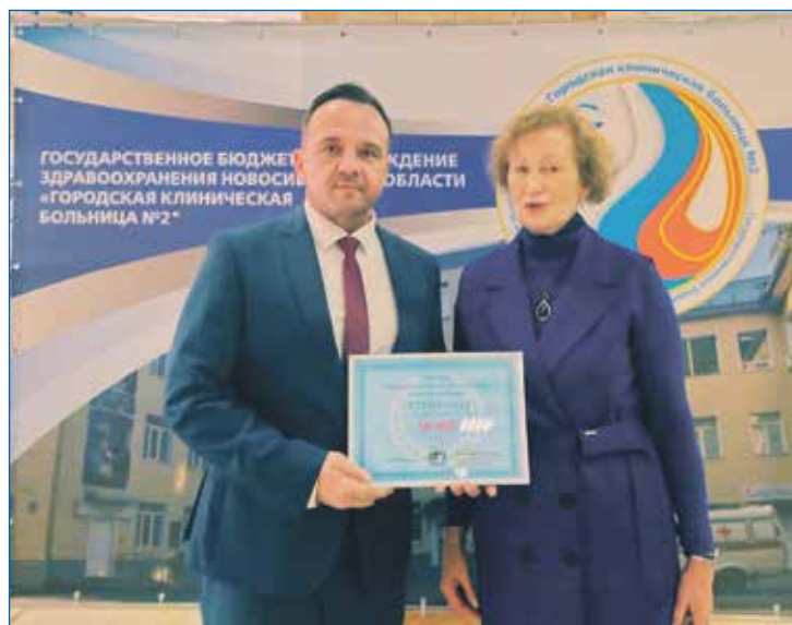
90-летие Городской клинической больницы № 2

— Что такое наказы избирателей? Это обычно какие-то глобальные вещи, которые волнуют многих жителей округа и которые собираются кандидатом в депутаты во время его избирательной кампании. То есть в горсовет или заксобрание депутат приходит с неким списком вопросов, решение которых он теперь в течение пяти лет — свой срок в избираемых органах власти — должен лоббировать в интересах своих избирателей. У нас в области — и наш регион в этом деле один из немногих — такое лоббирование даже закреплено на законодательном уровне. Так как проблемы глобальные — например, ремонт или строительство дорог, школ, поликлиник, то и реализация наказов предполагается обычно через включение их в региональные и федеральные программы для выделения соответствующего финансирования. Но наказы, повторюсь, собираются один раз в 5 лет перед выборами, а после выборов все эти пять лет каждую пятницу избиратели приходят ко мне как своему депутату на личный прием с самыми разными вопросами. Приходят представители организаций, расположенных на округе, — от ТСЖ и клубов до школ и библиотек. И я считаю, что именно решением таких вопросов и должен быть силен депутат. Каждый депутат сможет сидеть и ждать, когда профильные департаменты выполнят переданный наказ, но не каждый сможет работать экспромтом, с учетом реалий сегодняшнего дня. Но без ежедневной работы на округе депутат, на мой взгляд, не может оправдать ожидания своих избирателей.