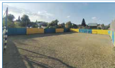
Приобретение материалов для обновления спортивной площадки, ТОС «Золотая горка»