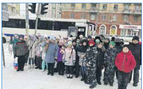
Организация досуга учащихся школ