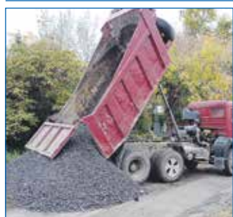
Ремонт дорог частного сектора