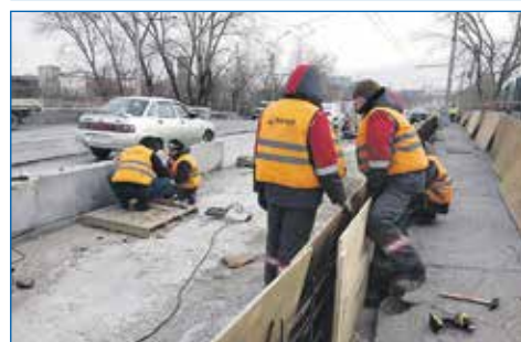
Ремонт правой полосы Горбатого моста