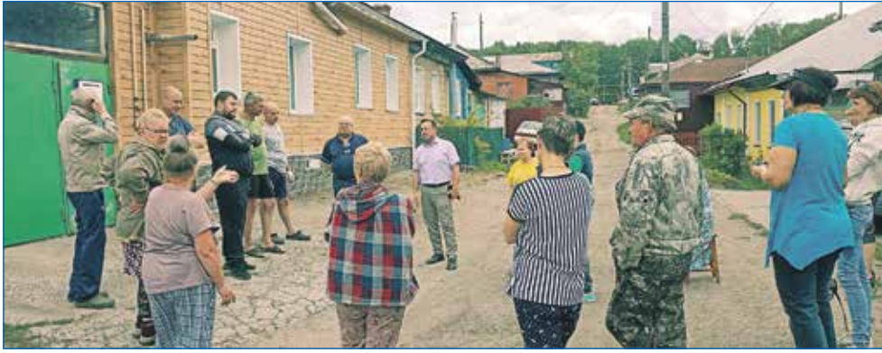
Встреча с жителями частного сектора