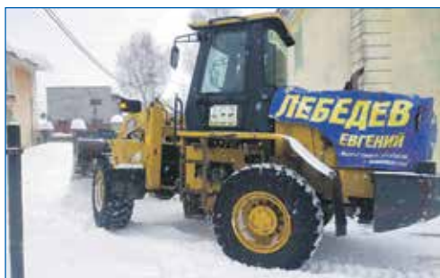
Ежедневная уборка снега в Дзержинском районе