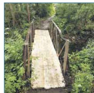
Ремонт моста через р. Каменка