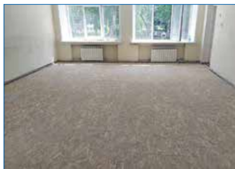
Ремонт пола в группе детского сада № 163