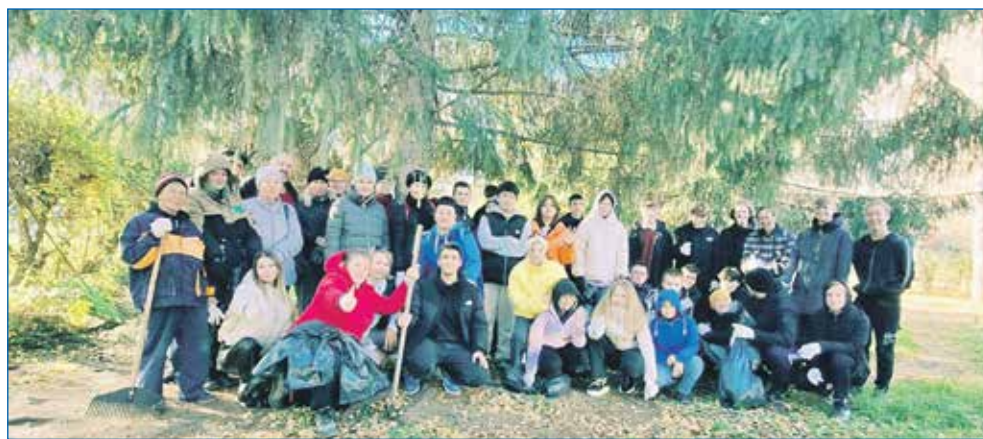
Октябрь 2023 года: субботник, очень радует, что столько неравнодушных людей ежегодно делают округ чистым, благоустроенным и комфортным