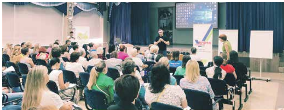
Работа с общественниками и экспертами на дискуссионной площадке Кировского района «Время требует»