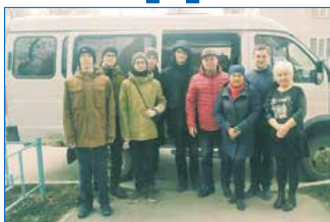
Вместе с волонтерами, учащимися школы №41, упаковали и отправили гуманитарную помощь в рамках акции «Посылка солдату»