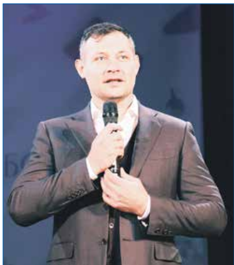
День учителя: чествование работников образования в ДДТ им. Ефремова