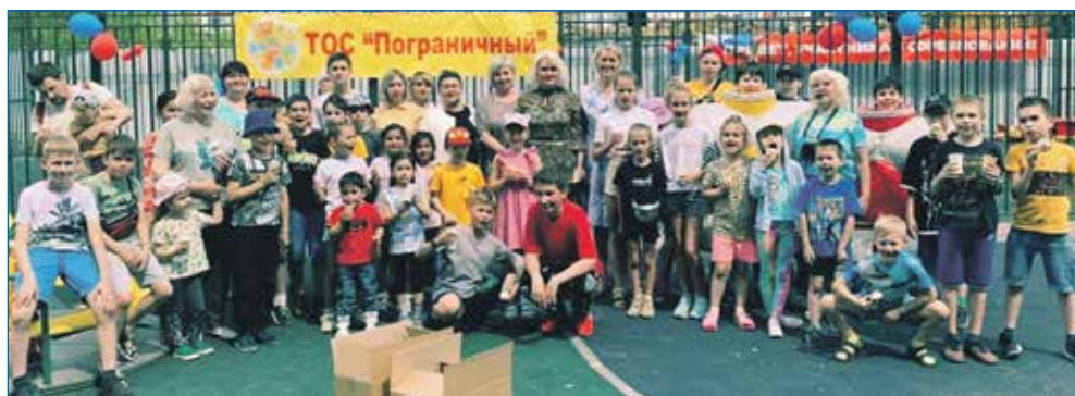
1 июня 2023 года: День защиты детей на округе