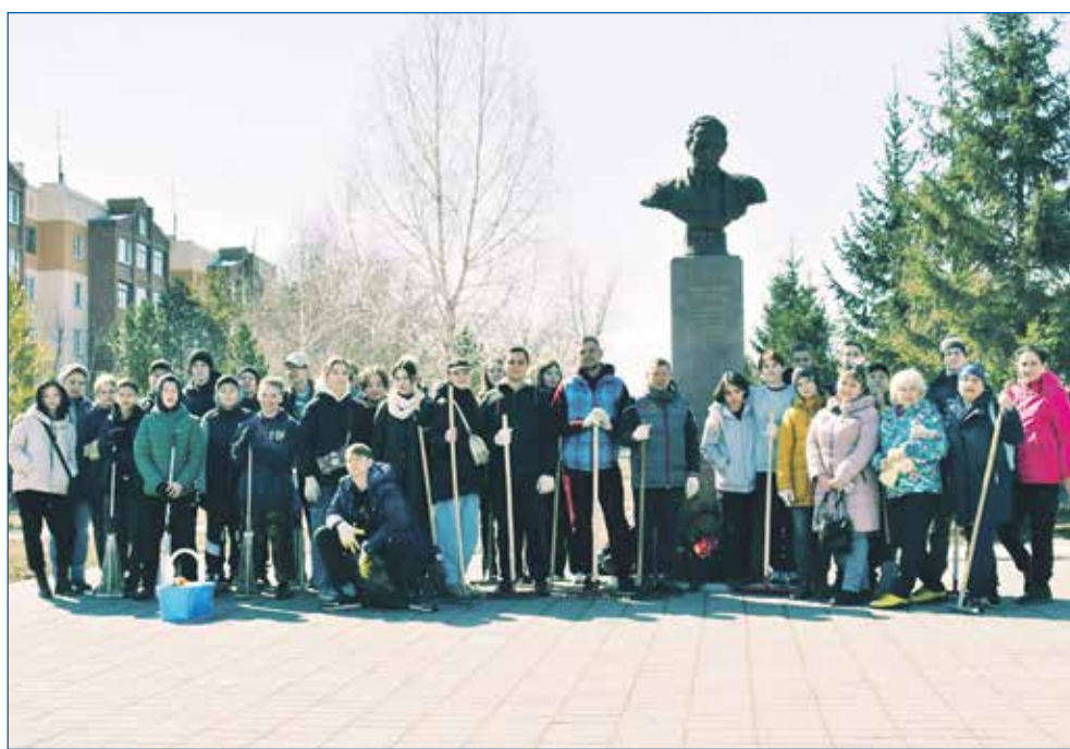
Субботник на округе, у памятника легендарному разведчику Рихарду Зорге

Не вызывает сомнения, что после выборов Президента РФ нам будут представлены обновленные цели и задачи развития страны, программы разрешения сложившихся проблем, этого неизбежно требуют те условия и обстоятельства, в которых