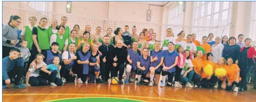
Турнир по волейболу, посвященный Дню матери

При работе по наказам сейчас подход к вопросу детских спортивных площадок придется менять. По регламенту площадка может эксплуатироваться 5–7 лет, после чего ежегодно придется производить ее экспертизу, стоимость которой по каждому элементу — порядка 3 тысяч рублей. А площадок в каждом районе города — уже сотни, то есть только на экспертизу будут уходить многие бюджетные миллионы.