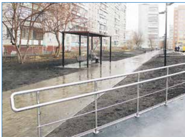
Аллея сквера «Радуга». Безопасный школьный маршрут вдоль ул. Киевской, 18