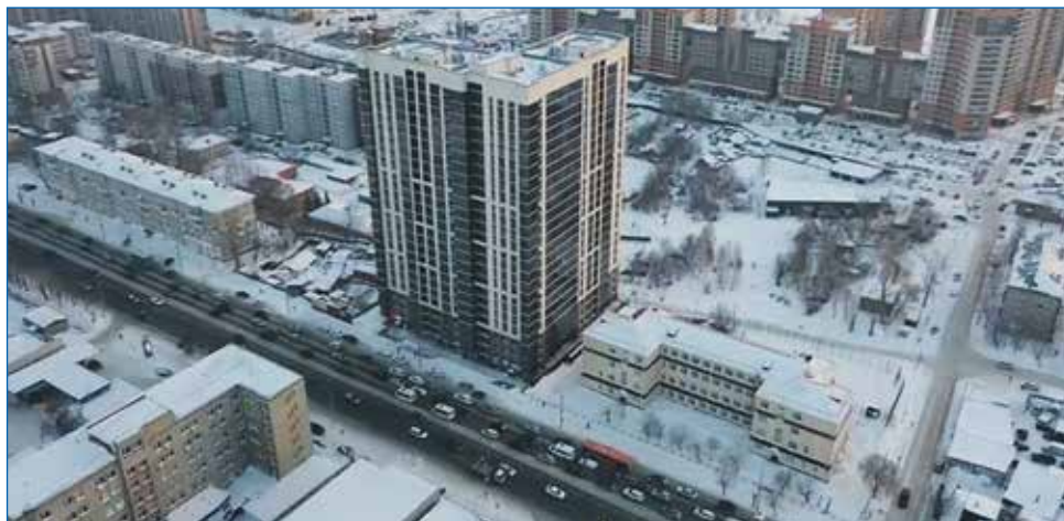
Как точечная застройка уродует Новосибирск. Новостройка «Расцветай на Обской» рядом со школой №76: вместо школьного двора — бетонная коробка

— Публично называть вещи своими именами. Округ депутата Заельцовского района, который развернул у нас активную предвы-