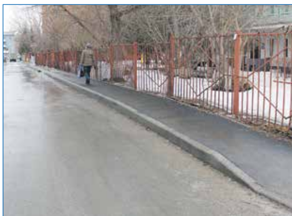
1-й пер. Пархоменко (дома 8-16). Отремонтированный проезд и пешеходная дорожка

Проведение акции по озеленению дворовых территорий «Кедр в каждый двор»; участие в организации праздничных мероприятий на территории округа; приобретение принтера для ТОС «Дружба»; демонтаж металлических гаражей рядом с домом Котовского, 32, на территории между Котовского, 36, и Котовского, 48; установка знака ограничения скорости вдоль ул. Дружбы.