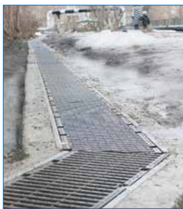
Котовского 26, 30. Водоотводной лоток для уменьшения подтоплений