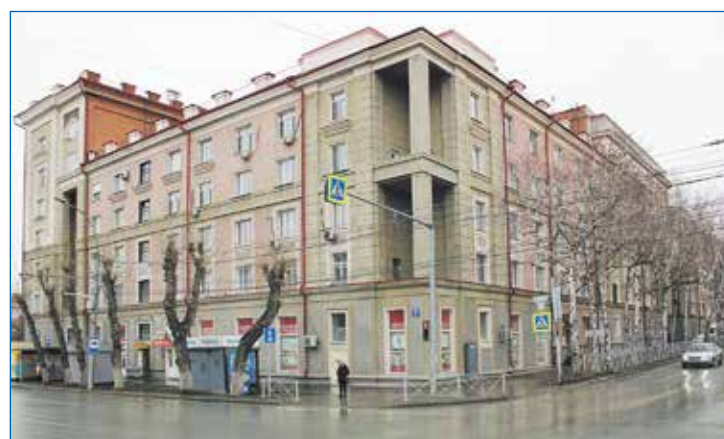
2024 год: дворы домов-памятников Станиславского, 4 и Станиславского, 7 в планах на комплексное благоустройство дворовых территорий