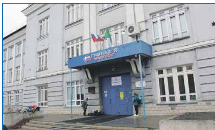
2024 год: школа 73 и гимназия 16 уходят на капитальный ремонт