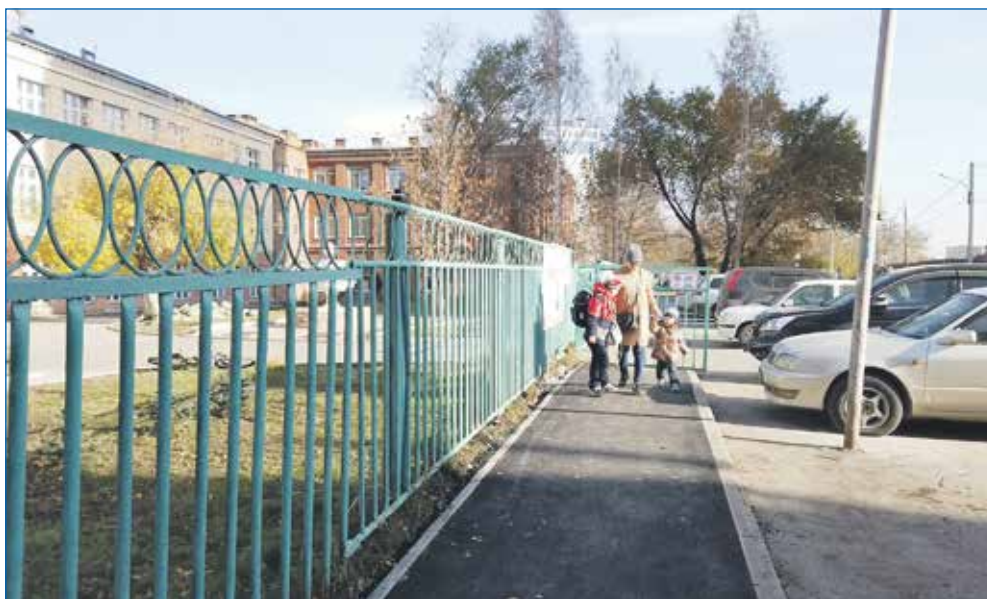
Тротуар, школа №43