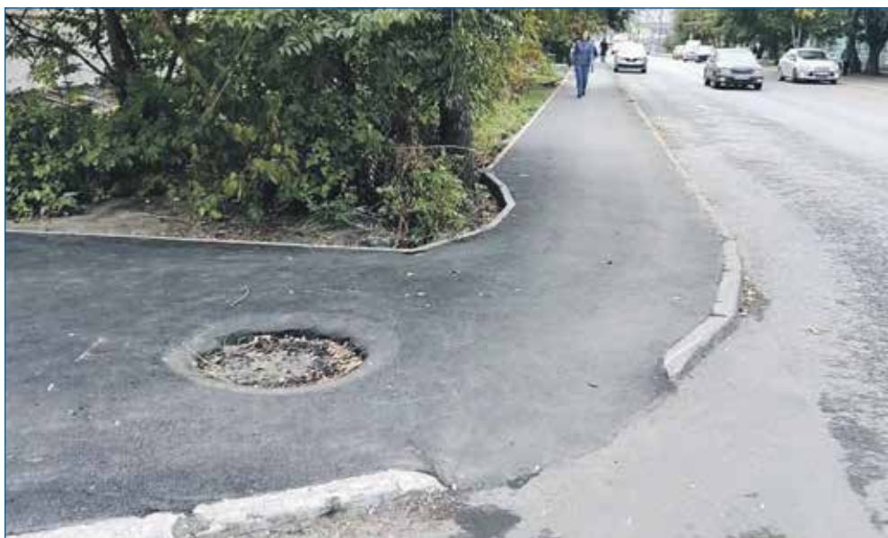
Тротуар напротив домов 90 и 92 по ул. Ленина