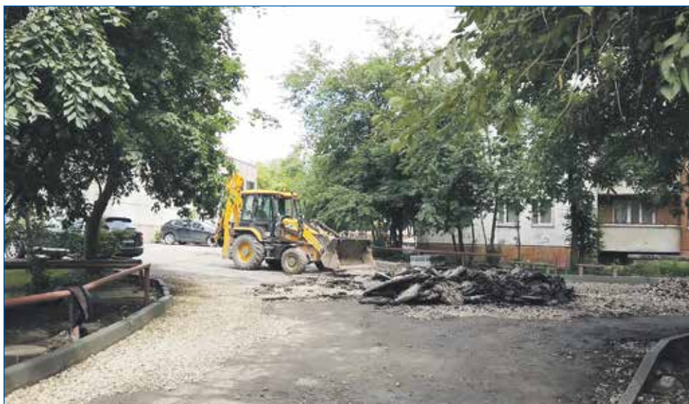
Благоустройство на ул. 1905 года, 21