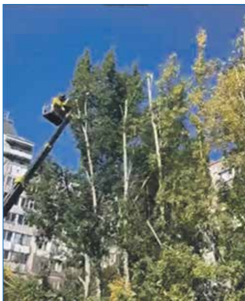
Обрезка деревьев на ул. Нарымской, 25