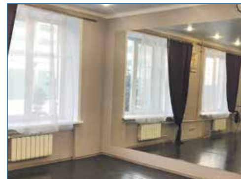
В Доме молодежи установлены новые окна