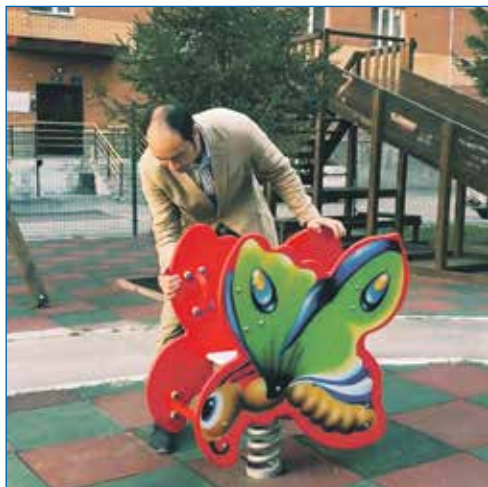
Качели во дворе на ул. Владимирской, 21, установлены надежно