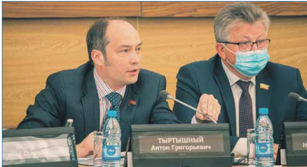
На сессии Совета депутатов города Новосибирска

— Отсутствие в плане конкретного срока исполнения наказа явилось для нас вынужденным решением. Депутатами в предвыборный период было принято большое количество наказов, но, повторю еще раз, муниципалитет Новосибирска не может ве-